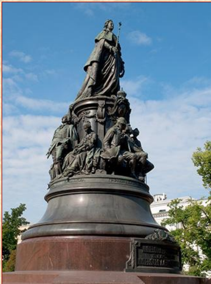
Памятник Екатерине II

Прочитайте о памятнике Екатерине II (с.72)