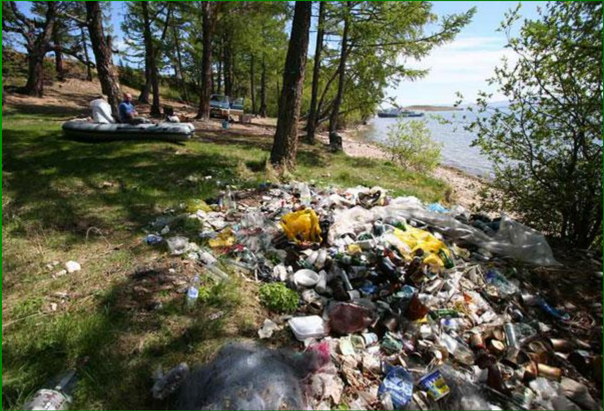
Бытовые отходы на берегах Балтики