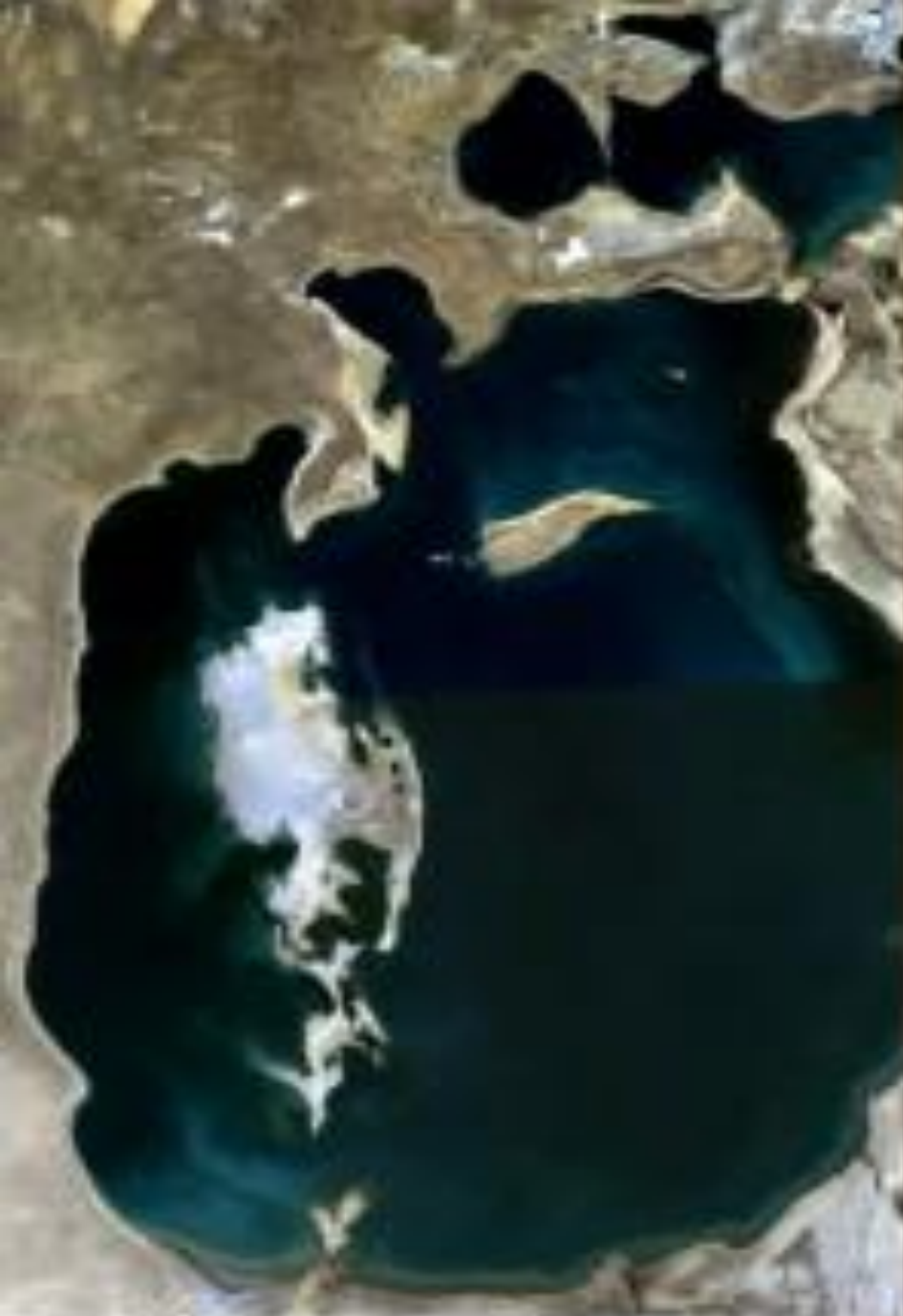
July - September, 1989