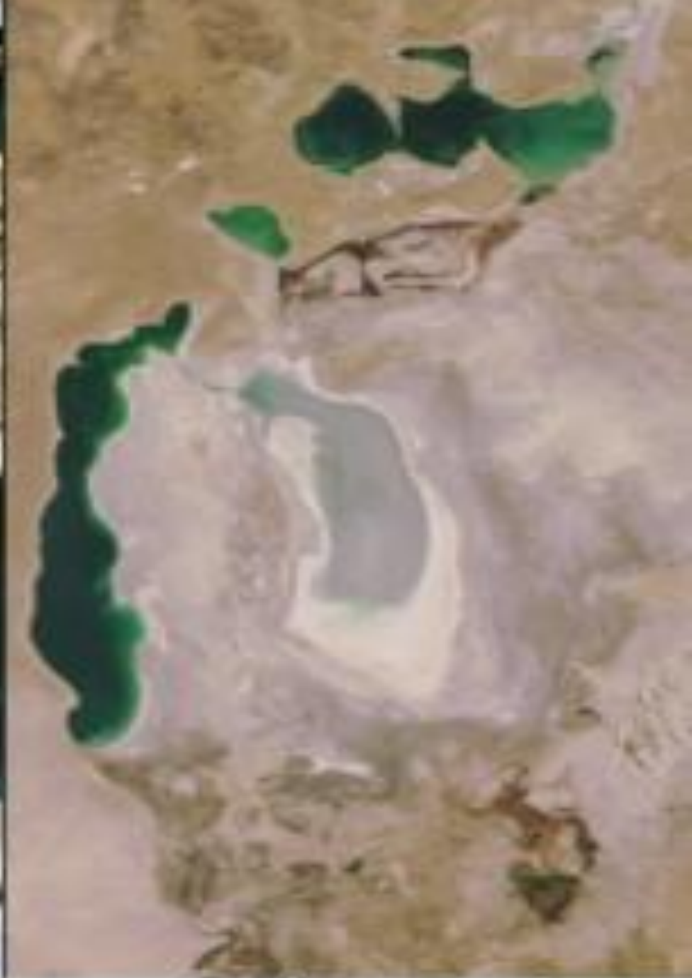
October 5, 2008