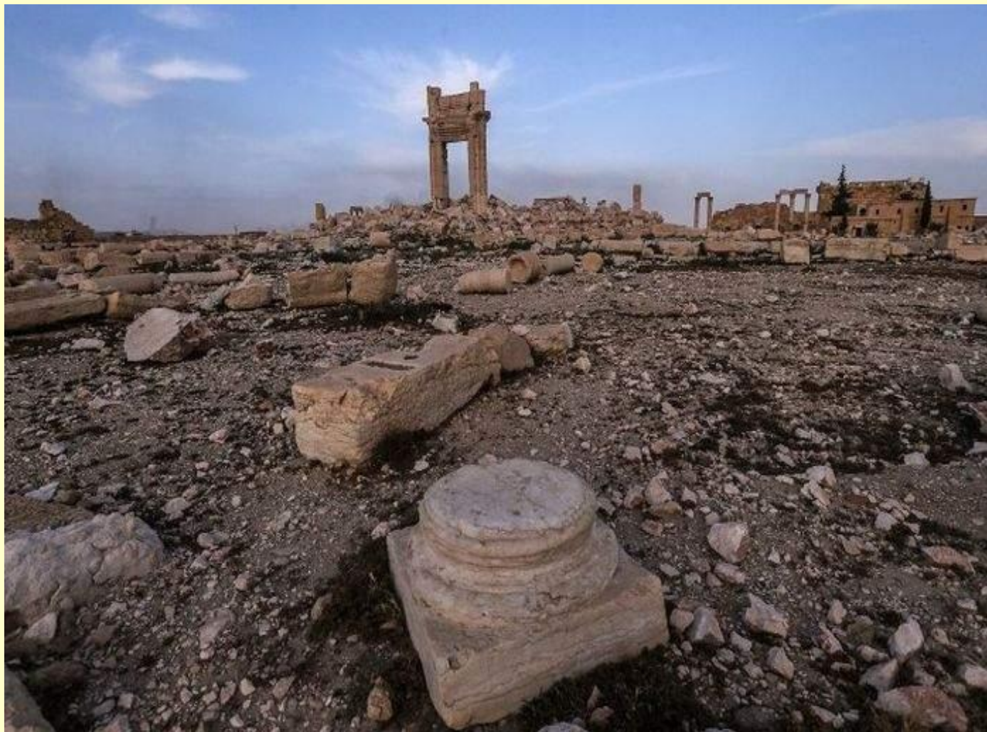
Развалины взорванного храма Баал-Шамин