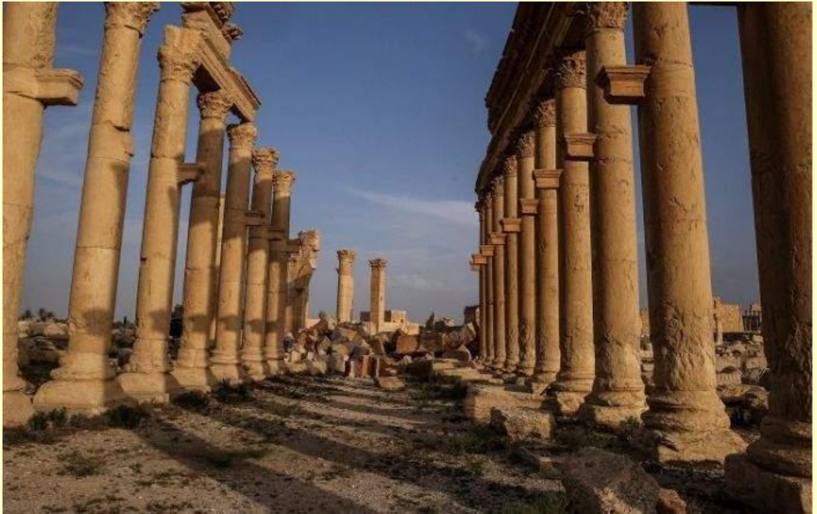
Великая колоннада в исторической части города