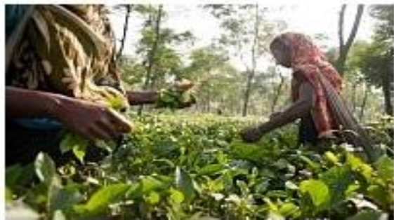
1. Сбор чайного листа