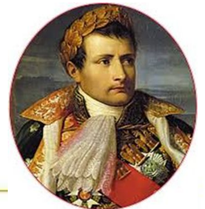
Наполеон Бонапарт (1769–1821)

Судопроизводство – это установленный законом порядок возбуждения, расследования, судебного рассмотрения и разрешения уголовных дел; подготовка судебного рассмотрения и разрешение гражданских дел