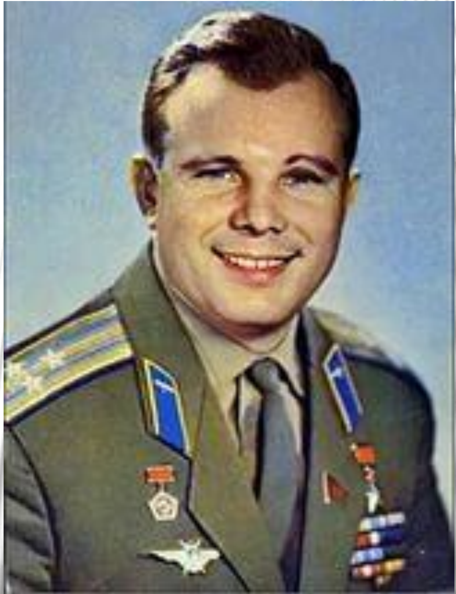
Юрий Алексеевич Гагарин