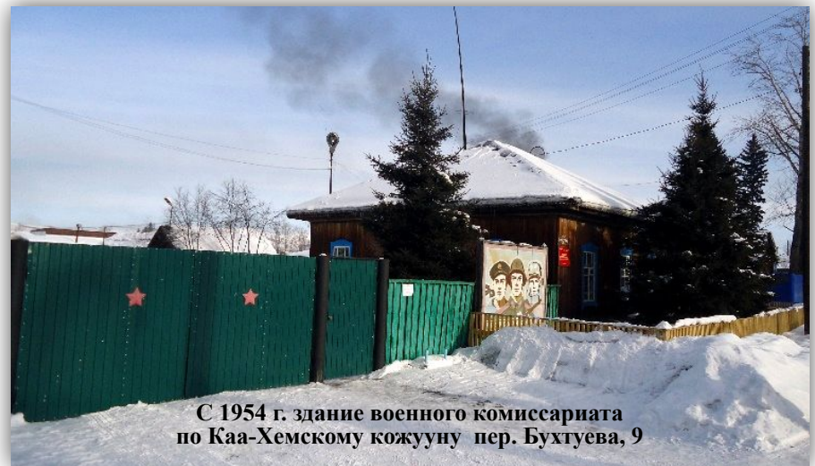
С 1954 г. здание военного комиссариата по Каа-Хемскому кожууну пер. Бухтуева, 9

Исполкомом Областного Совета депутатов трудящихся Тувинской Автономной Области 25 января 1945 года был создан районный военный комиссариат в Каа-Хемском районе.