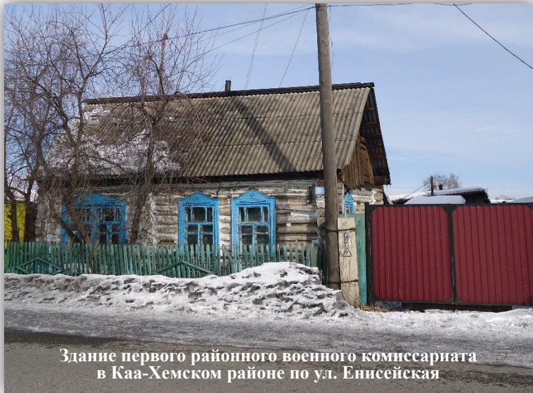
Здание первого районного военного комиссариата в Каа-Хемском районе по ул. Енисейская

В историческую победу Советского Союза над гитлеровской Германией внесли свой вклад и граждане Каа-Хемского района. На основании списка Тувинского Областного военного комиссариата № 1/65 от 19.01.1960 года было призвано миссией СССР в ТНР в Советскую армию 1204 человека в период с 1942-1944 год.