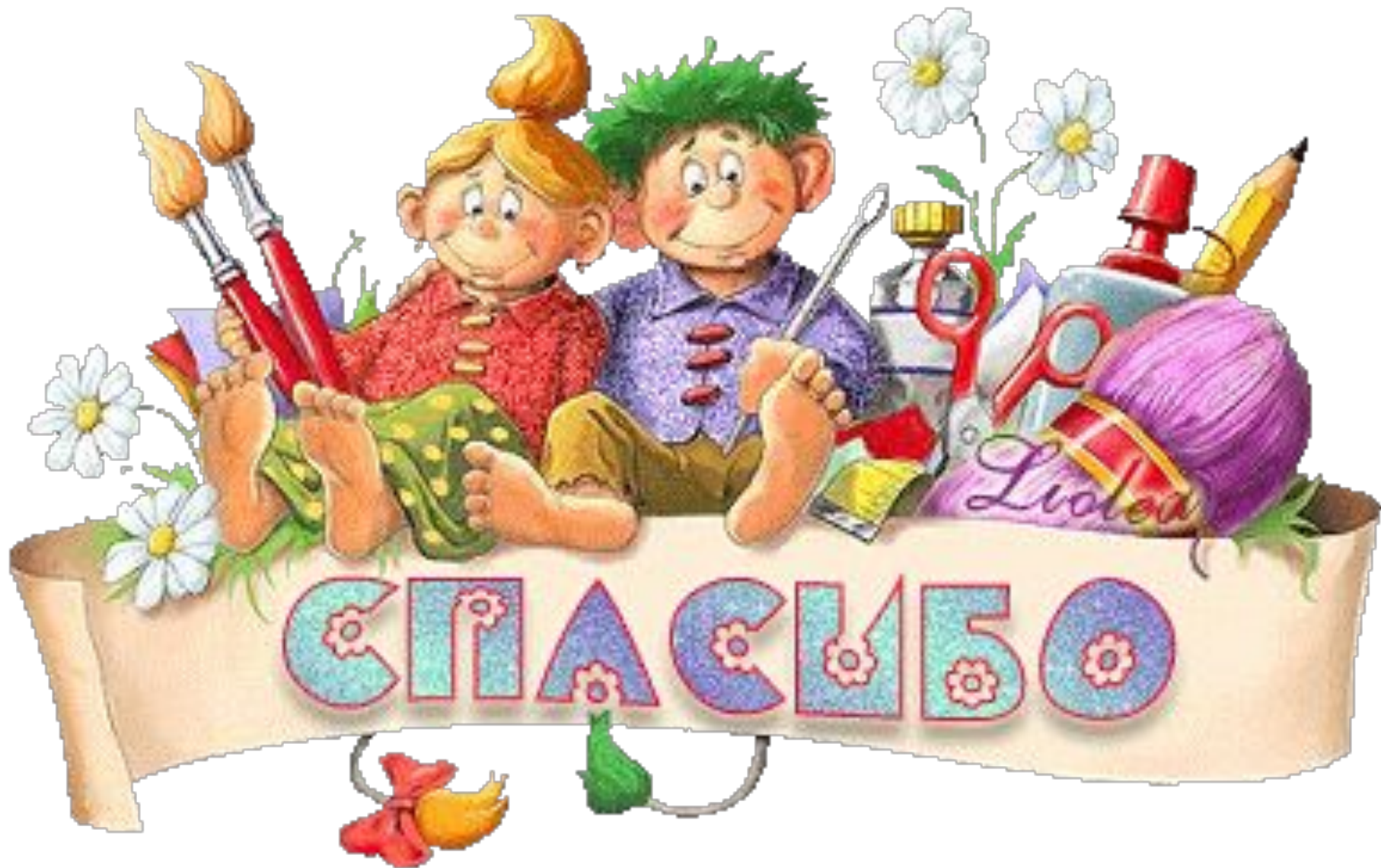
Фото рисунка пришлите учителю.