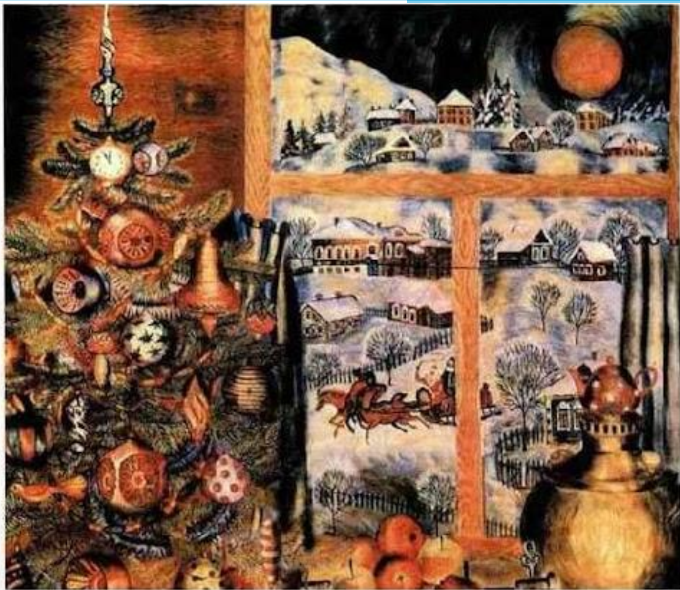
Л. ФРОЛЕНКОВА. Новый год.