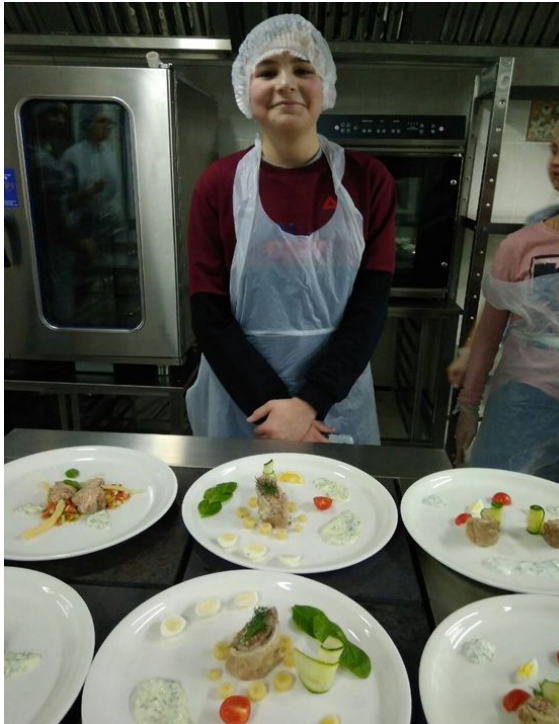
Компетенция «Поварское дело»