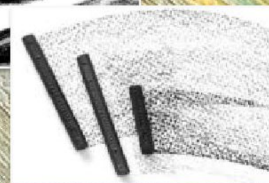
Рисунок - изображение, выполненное сразу на бумаге (карандашом, углем, пастелью, сепией, сангиной, соусом, пером,)