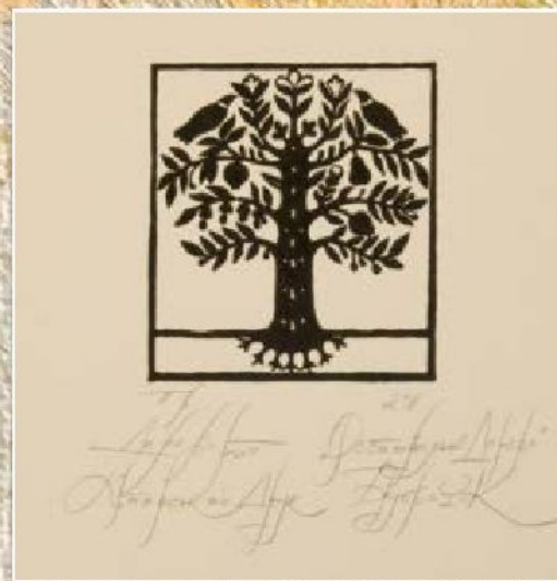
Гравюра в технике ксилографии

Найдите 2-3 примера графических произведений, вклейте их в рабочую тетрадь. Укажите какому виду графики они соответствуют (рисунок, гравюра), подпишите это под примером.