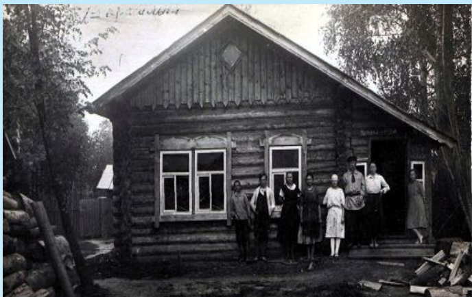
Здание школы ХОД - красильная мастерская.