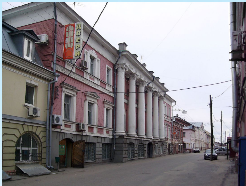
Здание клуба-чайной для бедноты «Столбы».