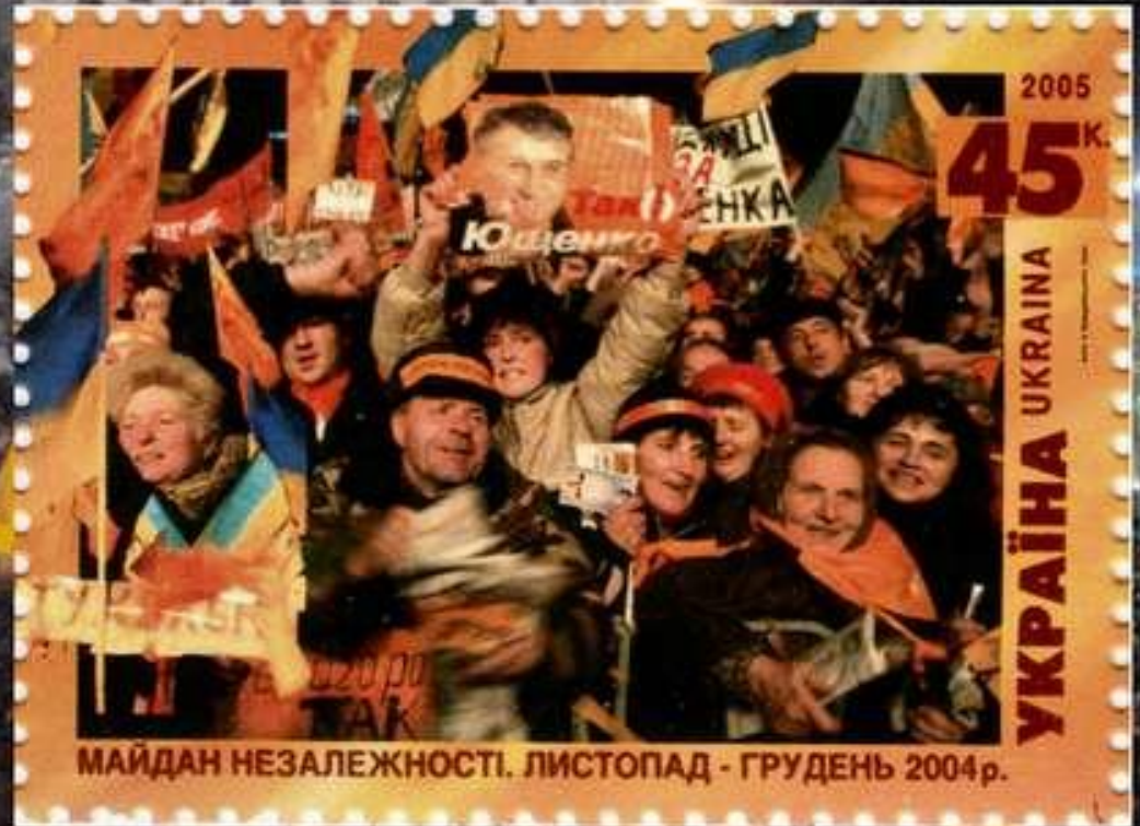
Помаранчева революція на поштовій марці України, 2006