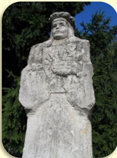
Памятник Франциску Скорине в Купаловском сквере (Минск).