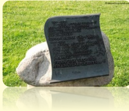
Памятный валун возле памятника Скорине в Праге