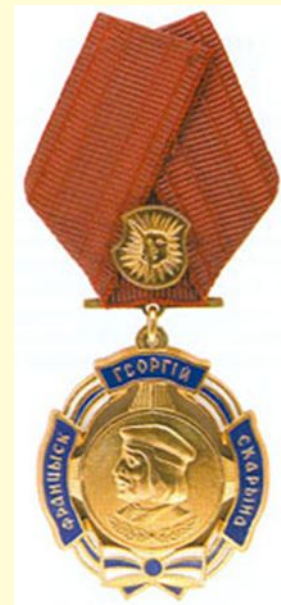
Орден Франциска Скорины