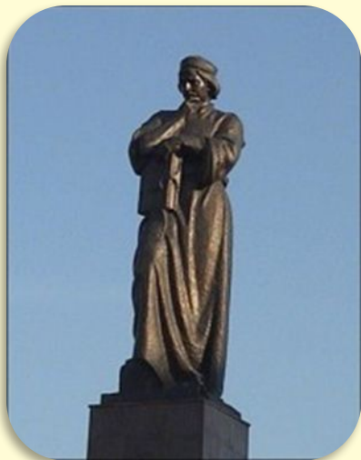
Памятник Франциску Скорине в Полоцке.