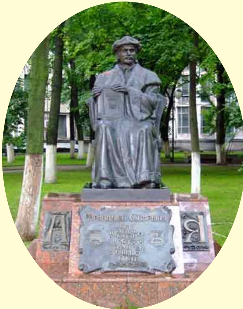
Памятник Франциску Скорине в Университетском дворике БГУ (Минск).