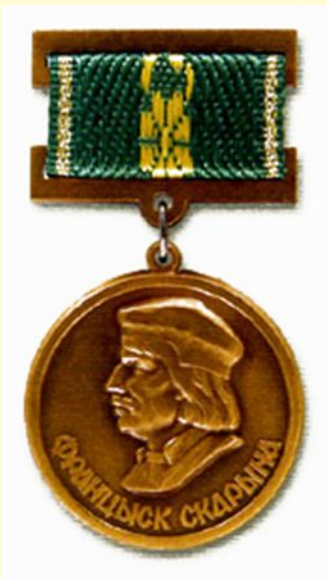
Медаль Франциска Скорины — самая старая белорусская медаль, учрежденная в 1989 году