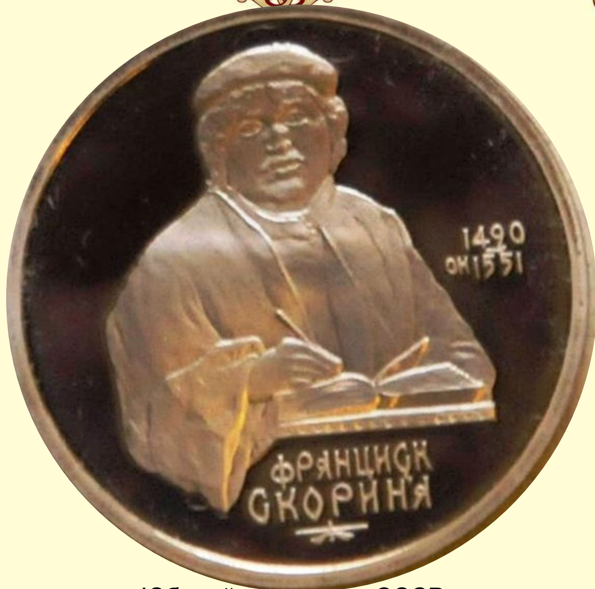
Юбилейная монета, СССР, 1990 год