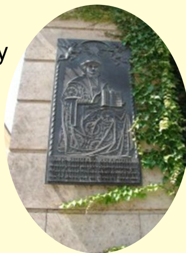
Мемориальная доска возле Парижской ратуши с информацией о том, что именно в этом месте Скорина перевел Библию