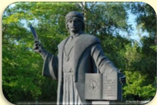
Памятник Франциску Скорине в Праге.