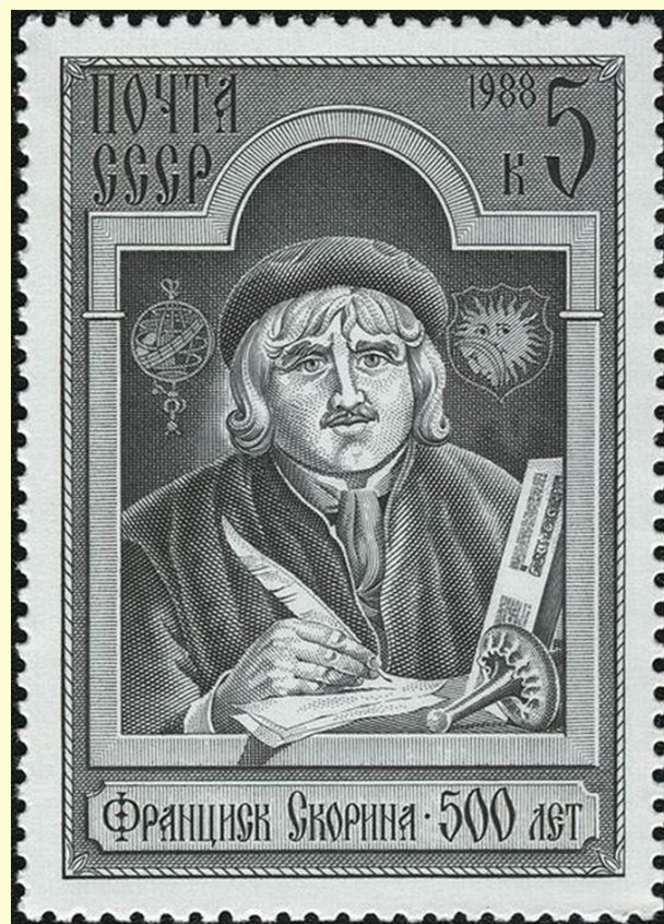
Марка СССР. 1988. ЦФА