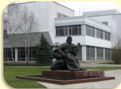
Памятник Франциску Скорине в Калининграде.