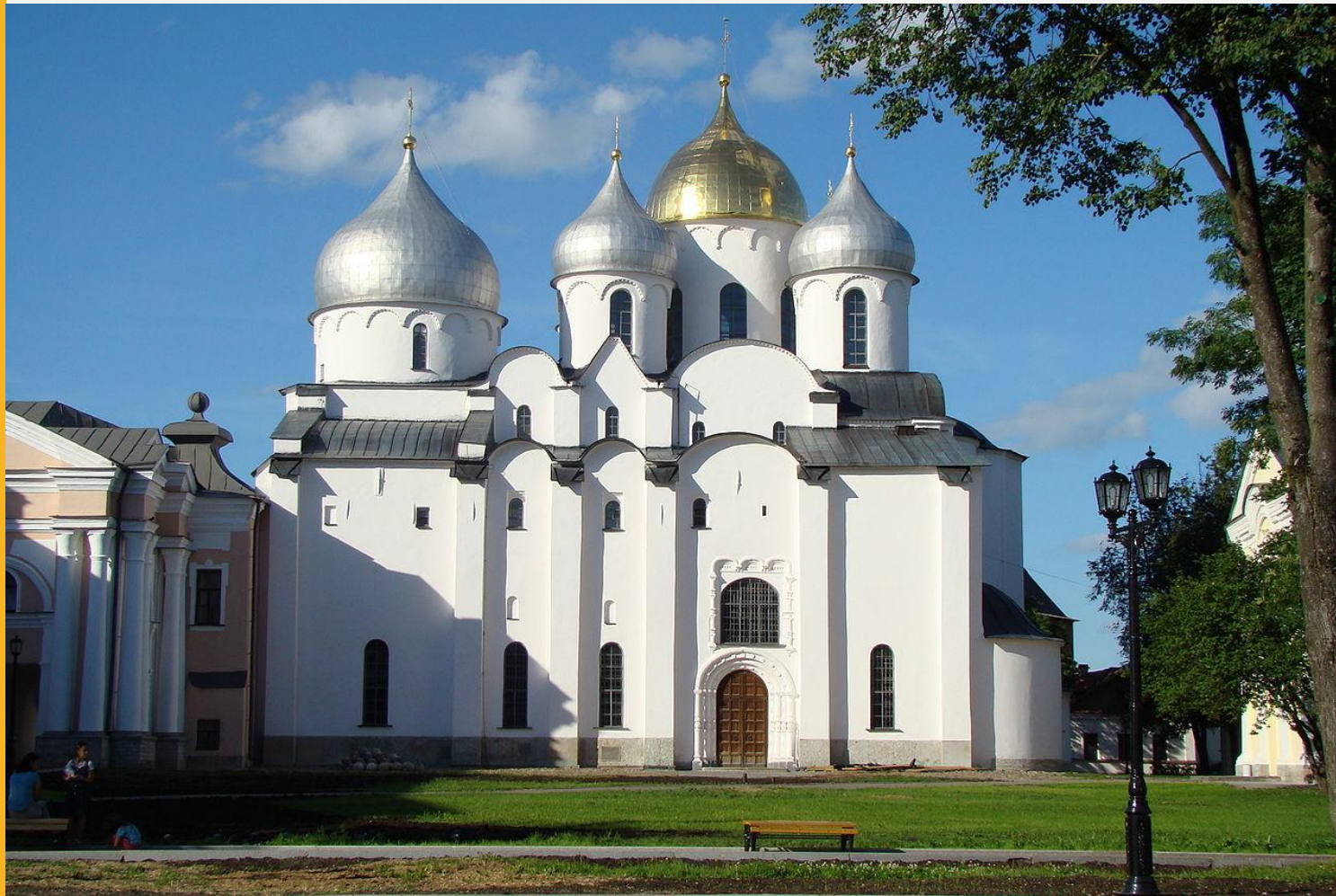
Собор Святой Софии в Новгороде

В основании крест символизирующий Крест Христов