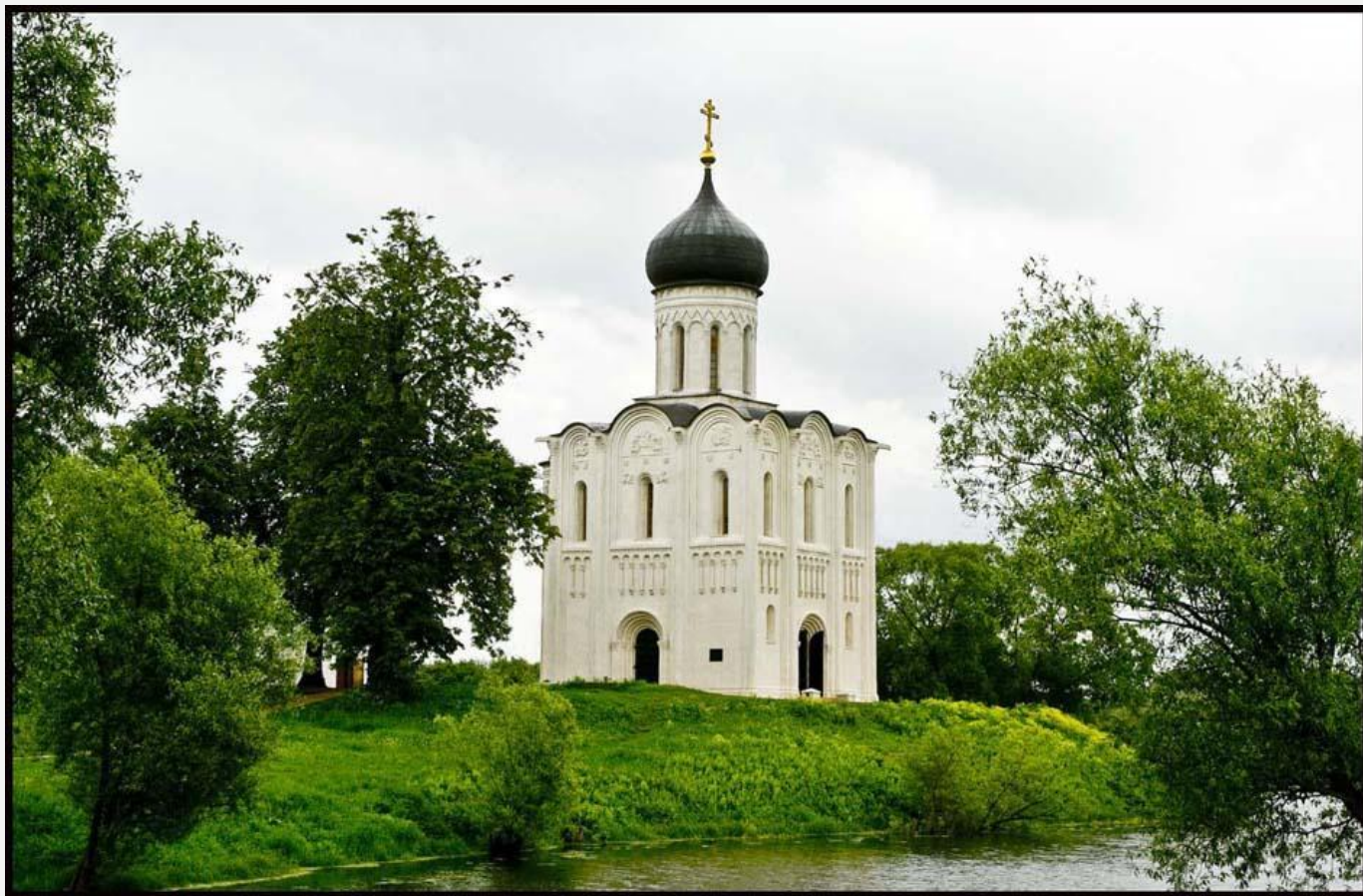
Церковь Покрова на Нерли