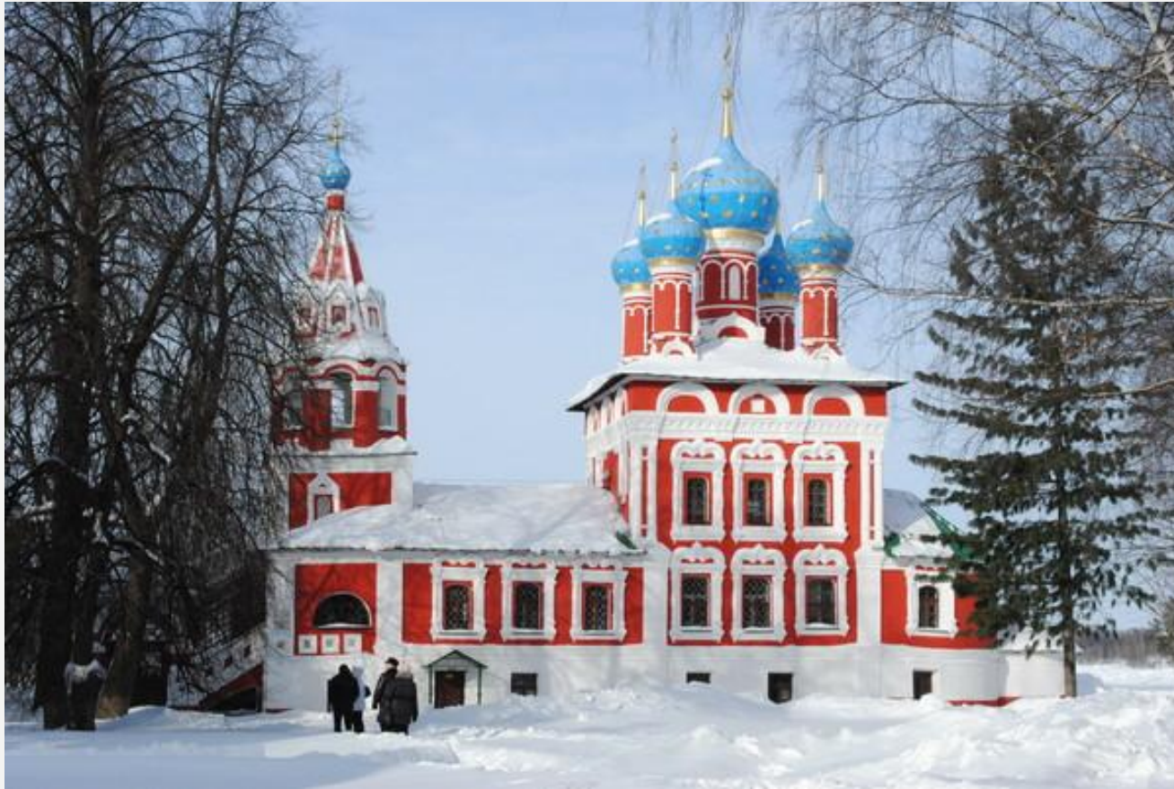
Церковь Дмитрия на Крови в Угличе

Символизирует Церковь как корабль спасения.