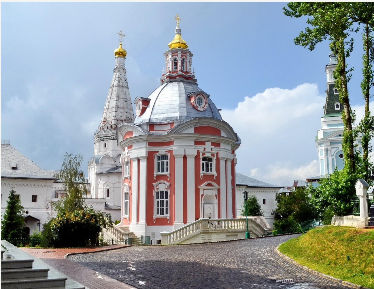
Смоленская церковь Троице Сергиевой Лавры