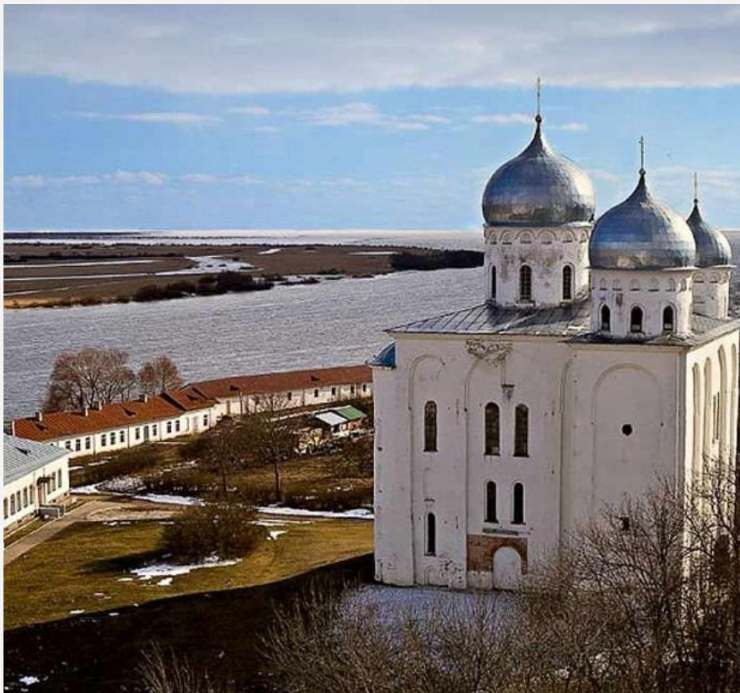
Георгиевский собор Юрьева Монастыря

ПРАВОСЛАВНЫЙ ХРАМ – ЦАРСТВО БОЖИЕ В ТРИЕДИНСТВЕ