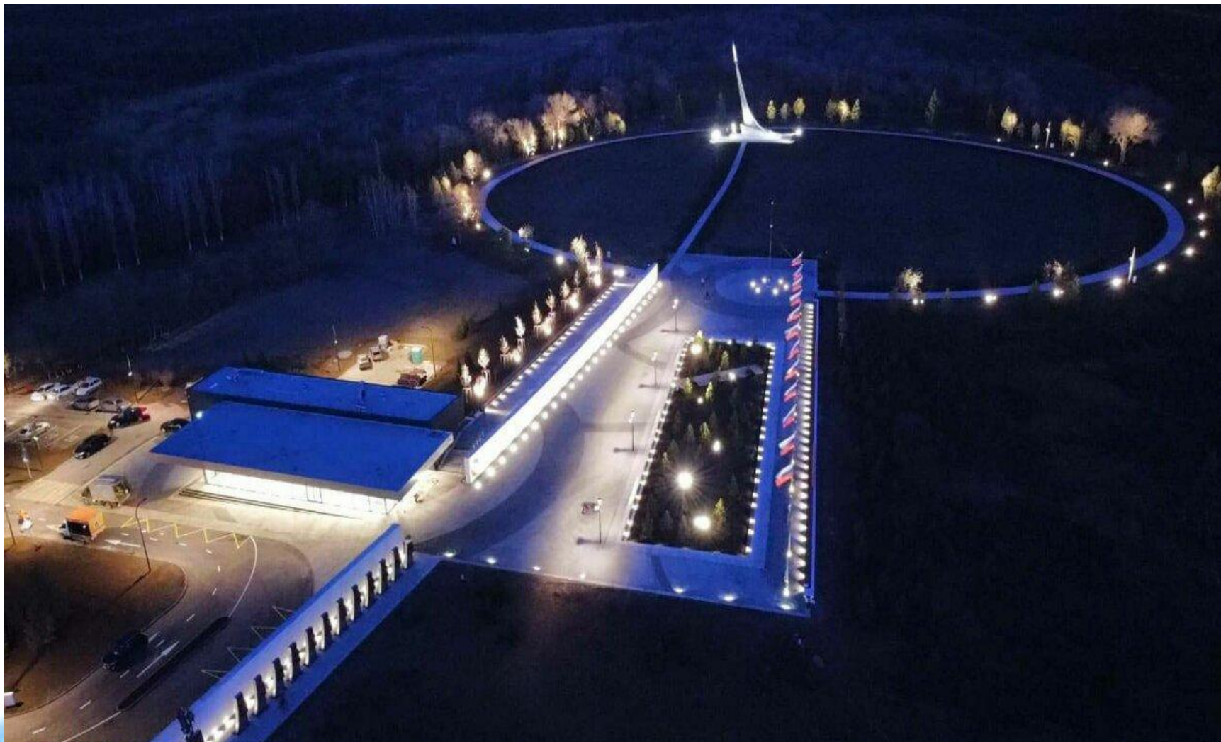
Комплекс «Парк покорителей космоса» Апрель 2021 года.