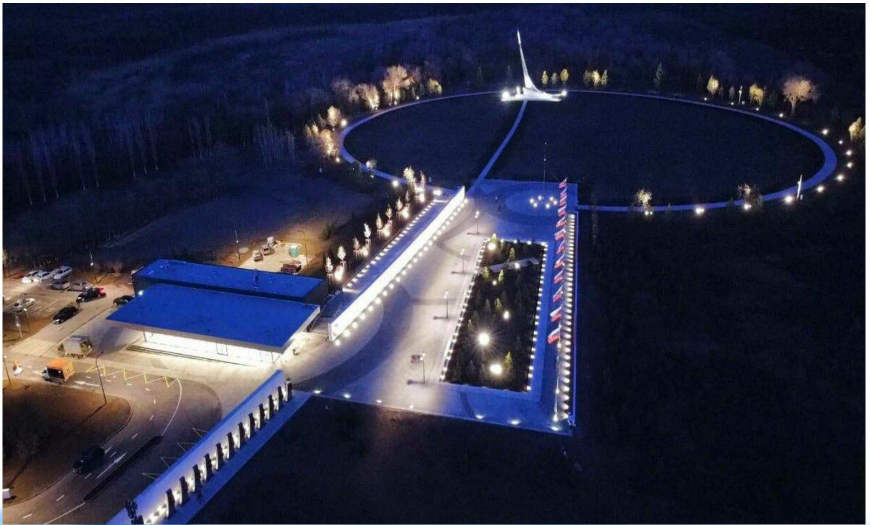
Комплекс «Парк покорителей космоса» Апрель 2021 года.