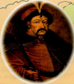
Багдан Хмельницькі, українські гетман (1595—1657)