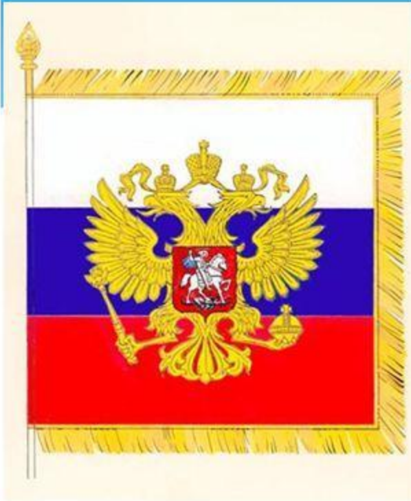
Штандарт Президента РФ