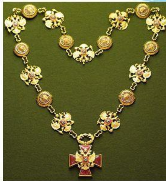
Знак Президента РФ