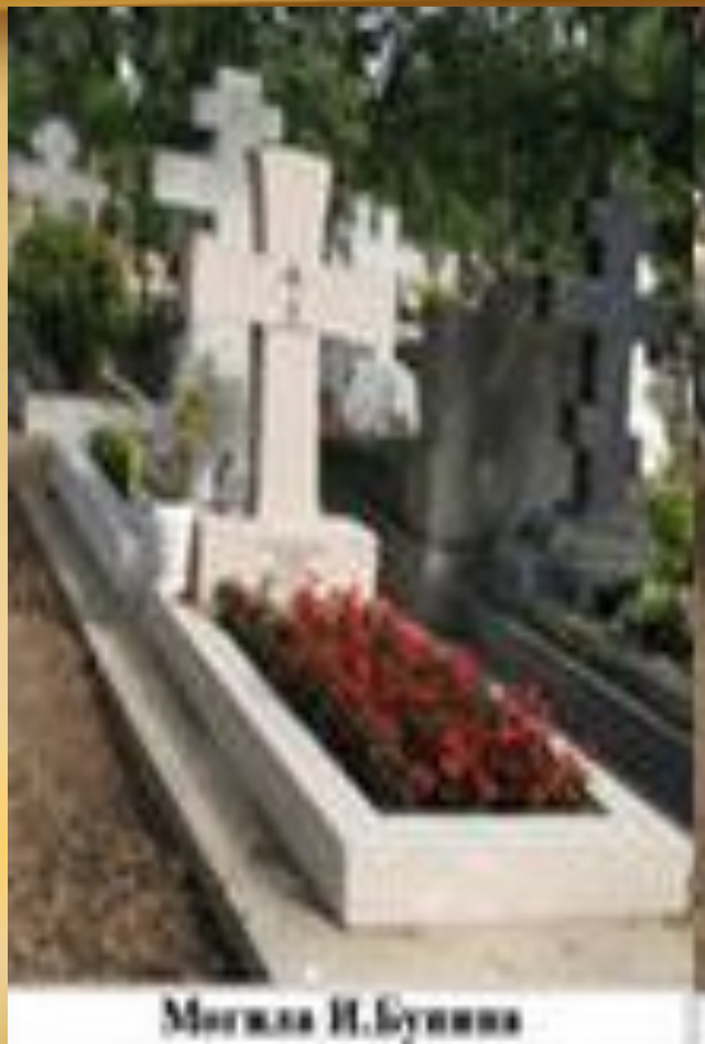
Могила И. Бунина