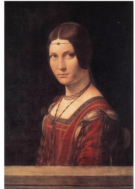
Леонардо да Винчи «Прекрасная Ферроньера» 1495 г. Дерево, масло. 62 x 44 см. Лувр, Париж