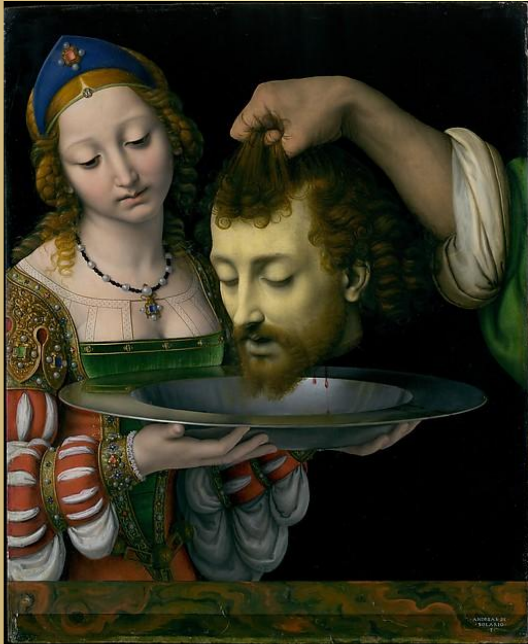
«Саломея с головой Иоанна Крестителя» 1506 – 1507 Андреа Соларио. Дерево, масло. 57,2 x 47 см.