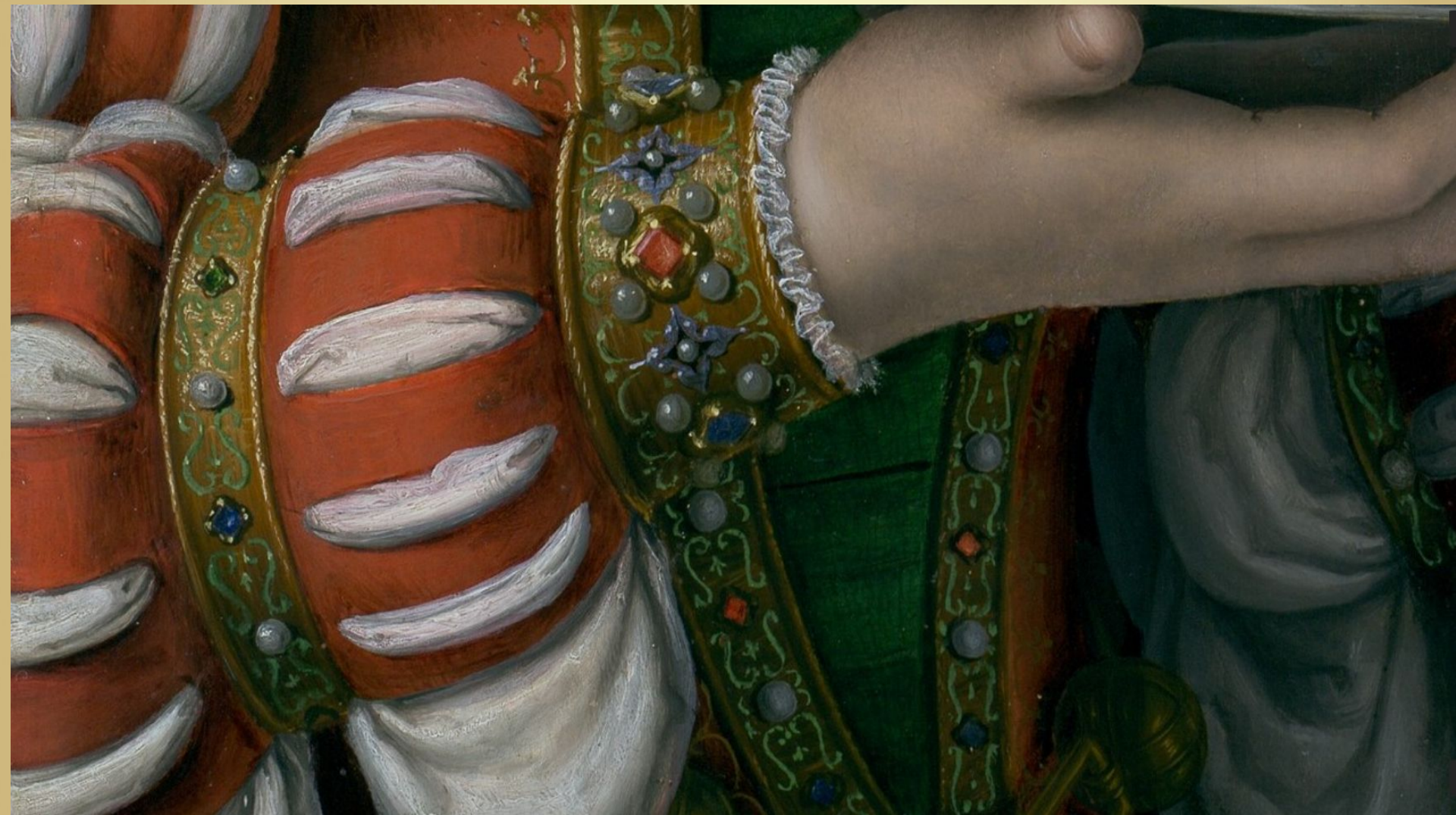
«Саломея с головой Иоанна Крестителя» 1506 – 1507 Андреа Соларио. Дерево, масло. 57,2 x 47 см. Деталь