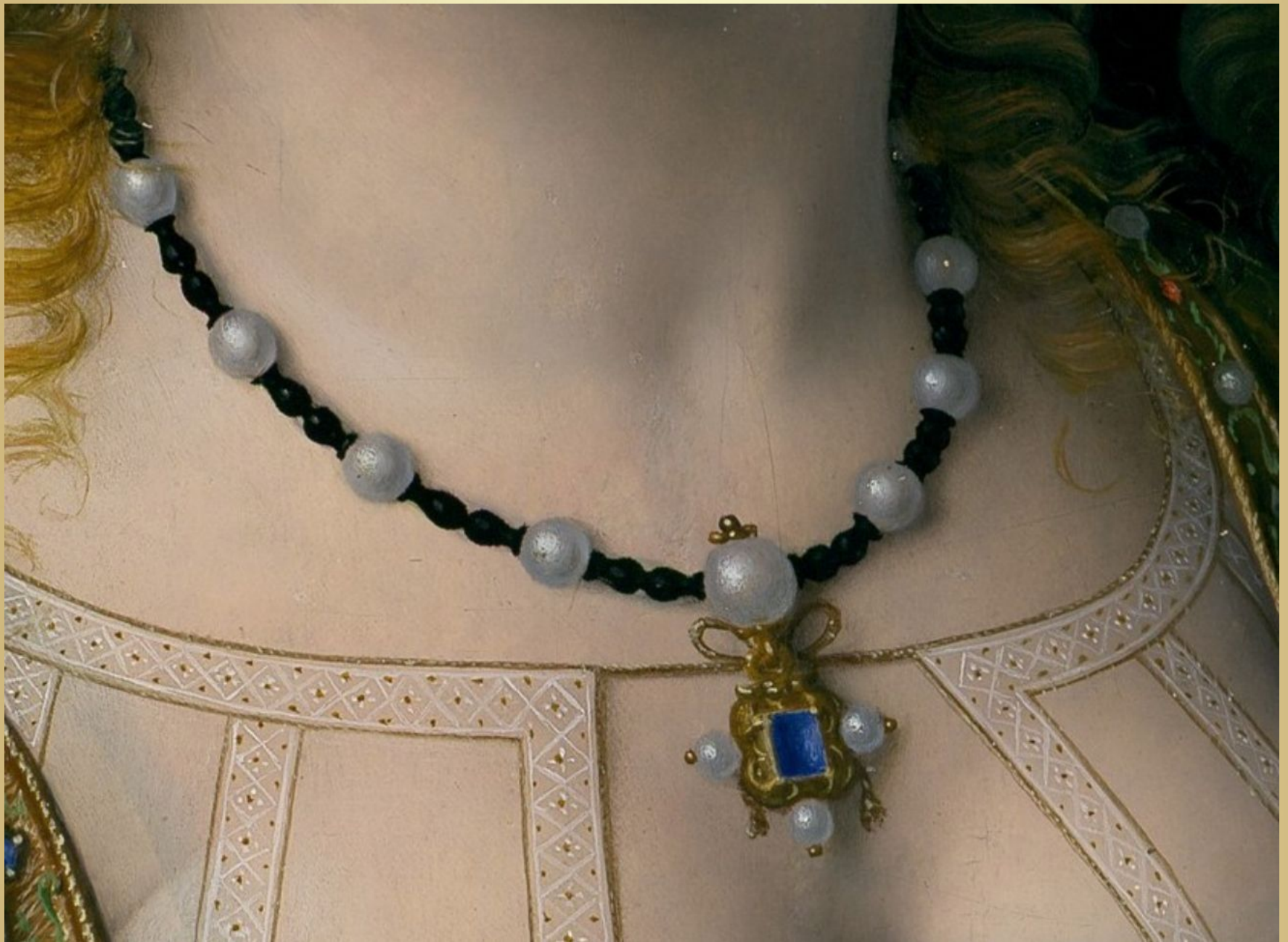
«Саломея с головой Иоанна Крестителя» 1506 – 1507 Андреа Соларио. Дерево, масло. 57,2 x 47 см. Деталь