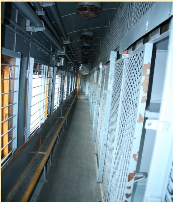
Вагон для перевозки заключенных