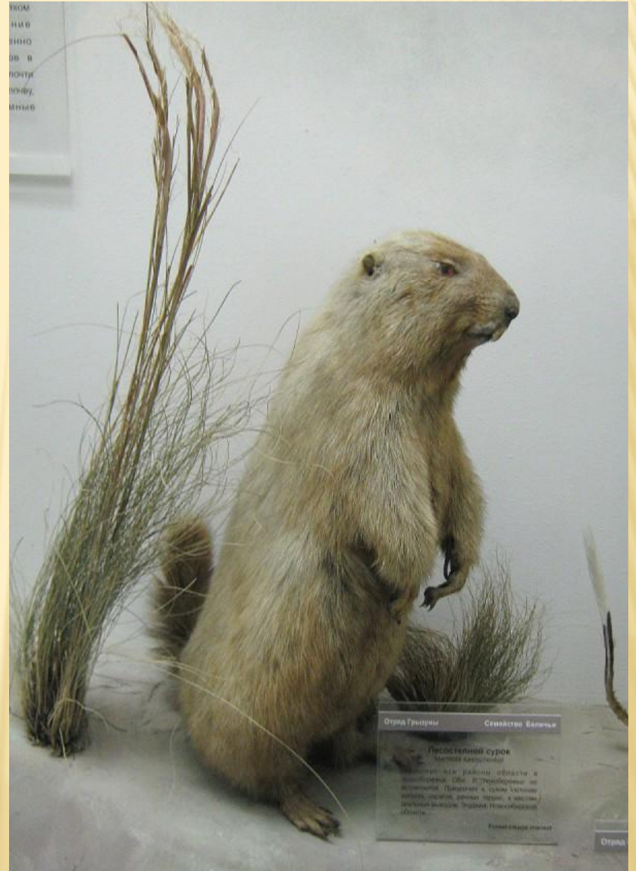
Отряд Грызуны Семство Вальчи Песостелной сурок Citellus karyakchensis Обитает в равнинных областях в Тыве, Сибири и Туве. Встречается на высотах до 4000 м. Питается травой, овощами, зерновыми, а также различными насекомыми. Заповедник Калба. Государственный музей