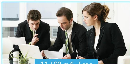
Юрист для бизнеса