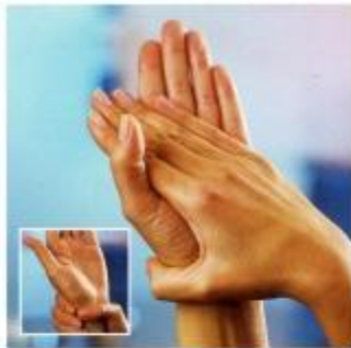
Ладонь к ладони, включая запястья