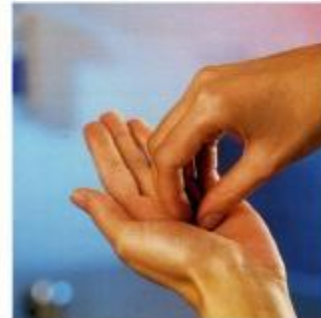
Кругообразное втирание сомкнутых кончиков пальцев правой руки на левой ладони и наоборот