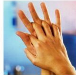
Ладонь к ладони рук с перекрещенными пальцами