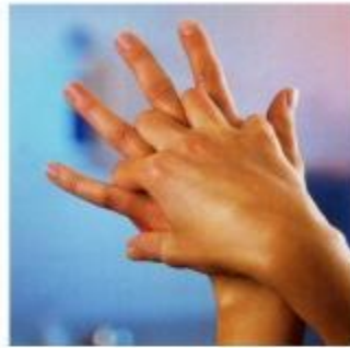
Правая ладонь на левую тыльную сторону кисти и левая ладонь на правую тыльную сторону кисти