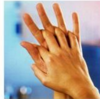
Ладонь к ладони рук с перекрещенными пальцами