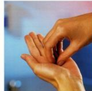
Кругообразное втирание сомкнутых кончиков пальцев правой руки на левой ладони и наоборот