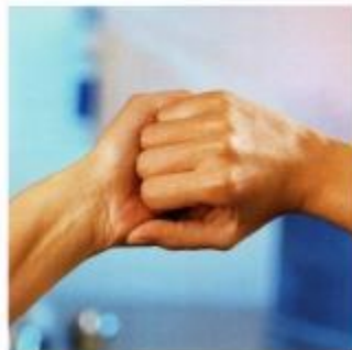
Внешняя сторона пальцев на противоположной ладони с перекрещенными пальцами