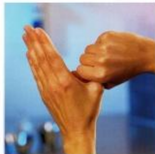
Кругообразное растирание левого большого пальца в закрытой ладони правой руки и наоборот