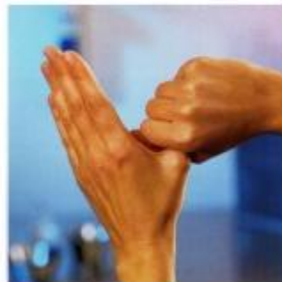
Кругообразное растирание левого большого пальца в закрытой ладони правой руки и наоборот