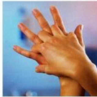
Правая ладонь на левую тыльную сторону кисти и левая ладонь на правую тыльную сторону кисти