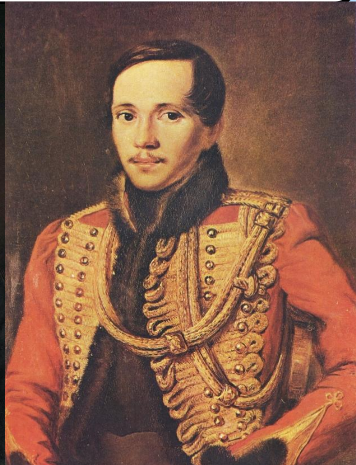
М. Ю. Лермонтов