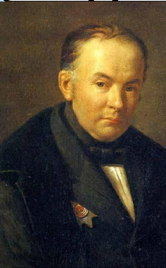
В. А. Жуковский