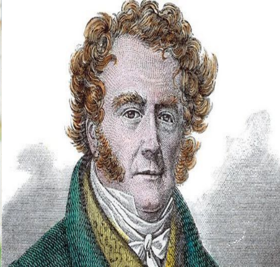
Эжен Франсуа Видок