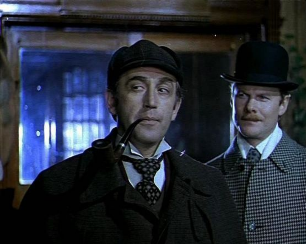
Лучший Шерлок Холмс в исполнении Василия Ливанова