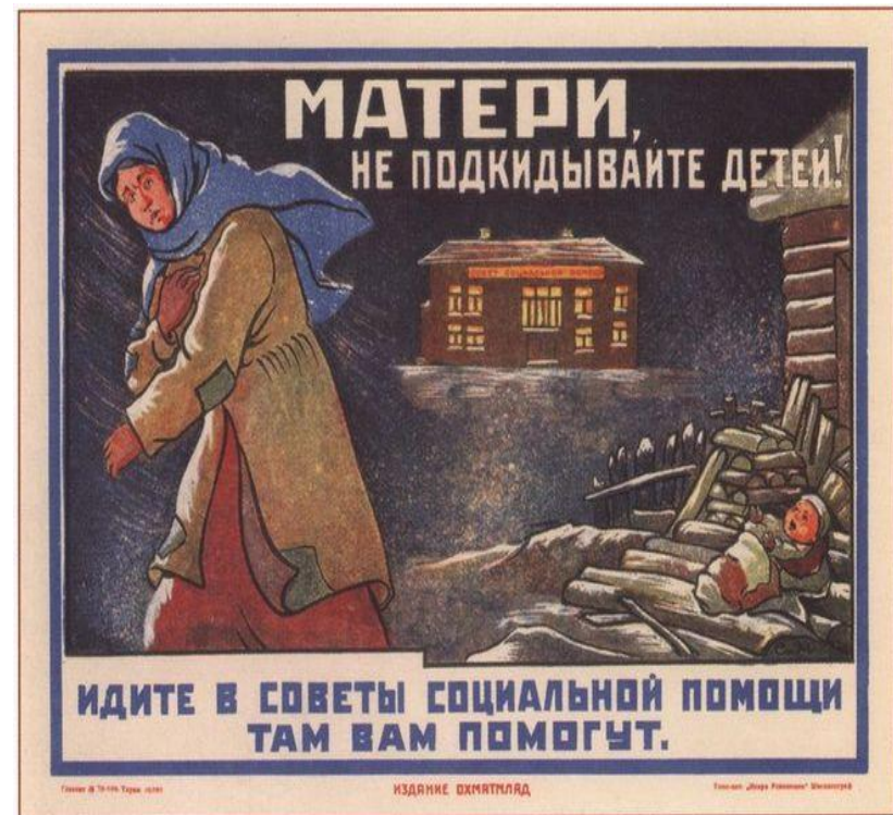
450. Соболева А.(?) Матери, не подкидывайте детей! 1925