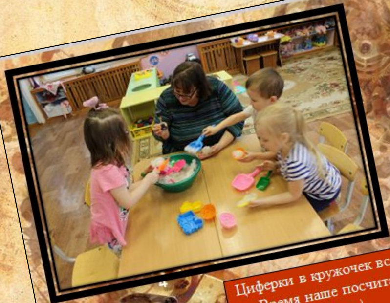
Циферки в кружочек встали — Время наше посчитали. (Часы)

Handwritten text in cursive script, including the date "1833" and the name "Cathall".