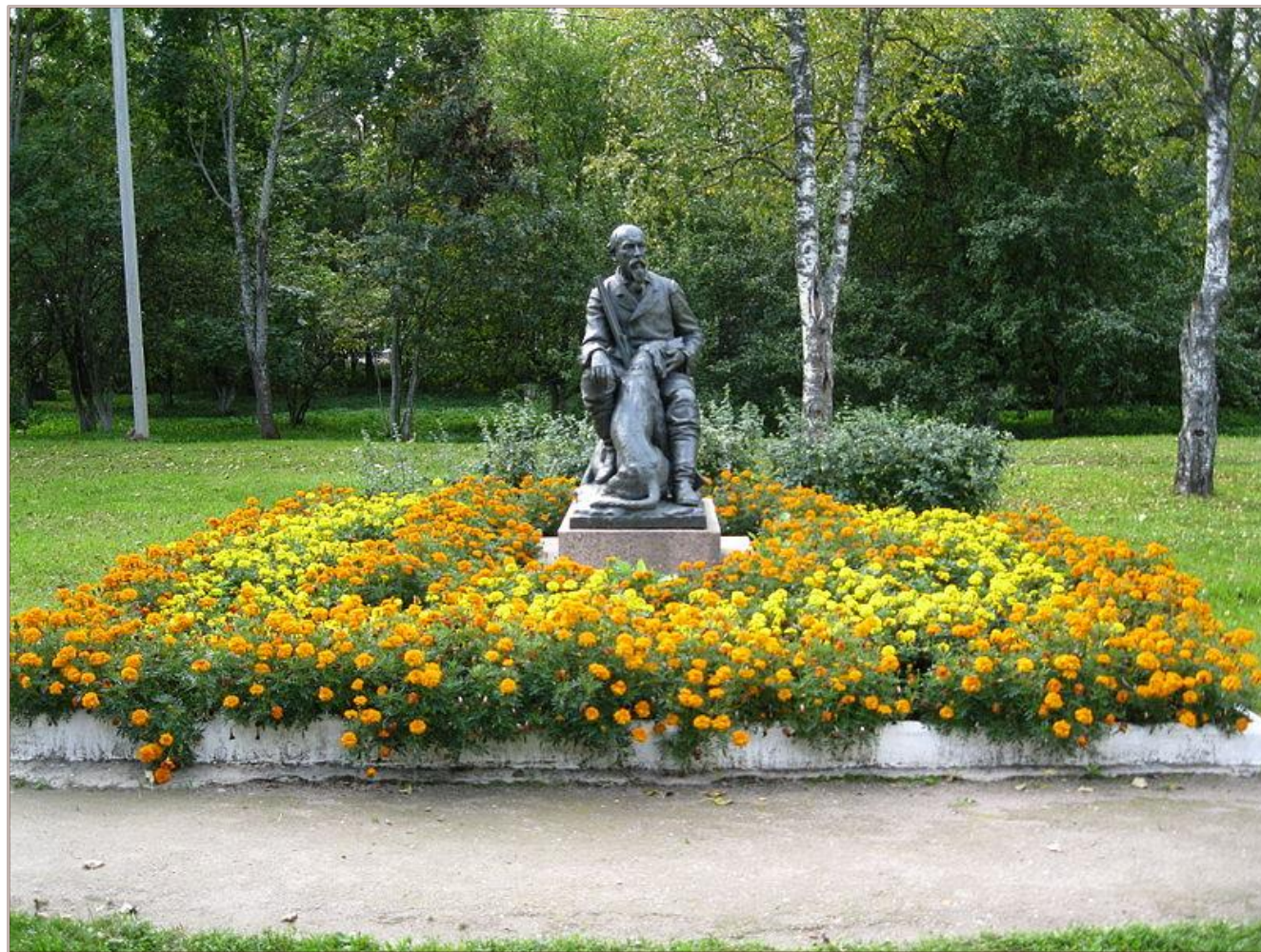
Н.А.Некрасов с любимой собакой Кадо.