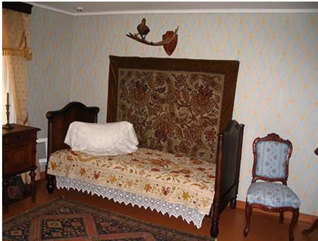
Комната для гостей