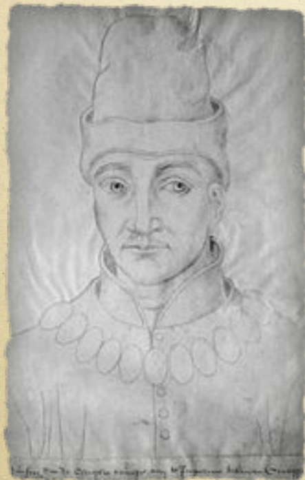
Хамфри, герцог Глостерский