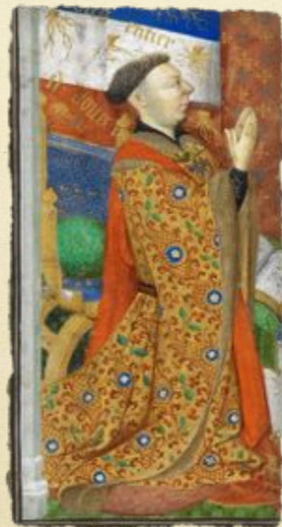
Джон, герцог Бенфорд