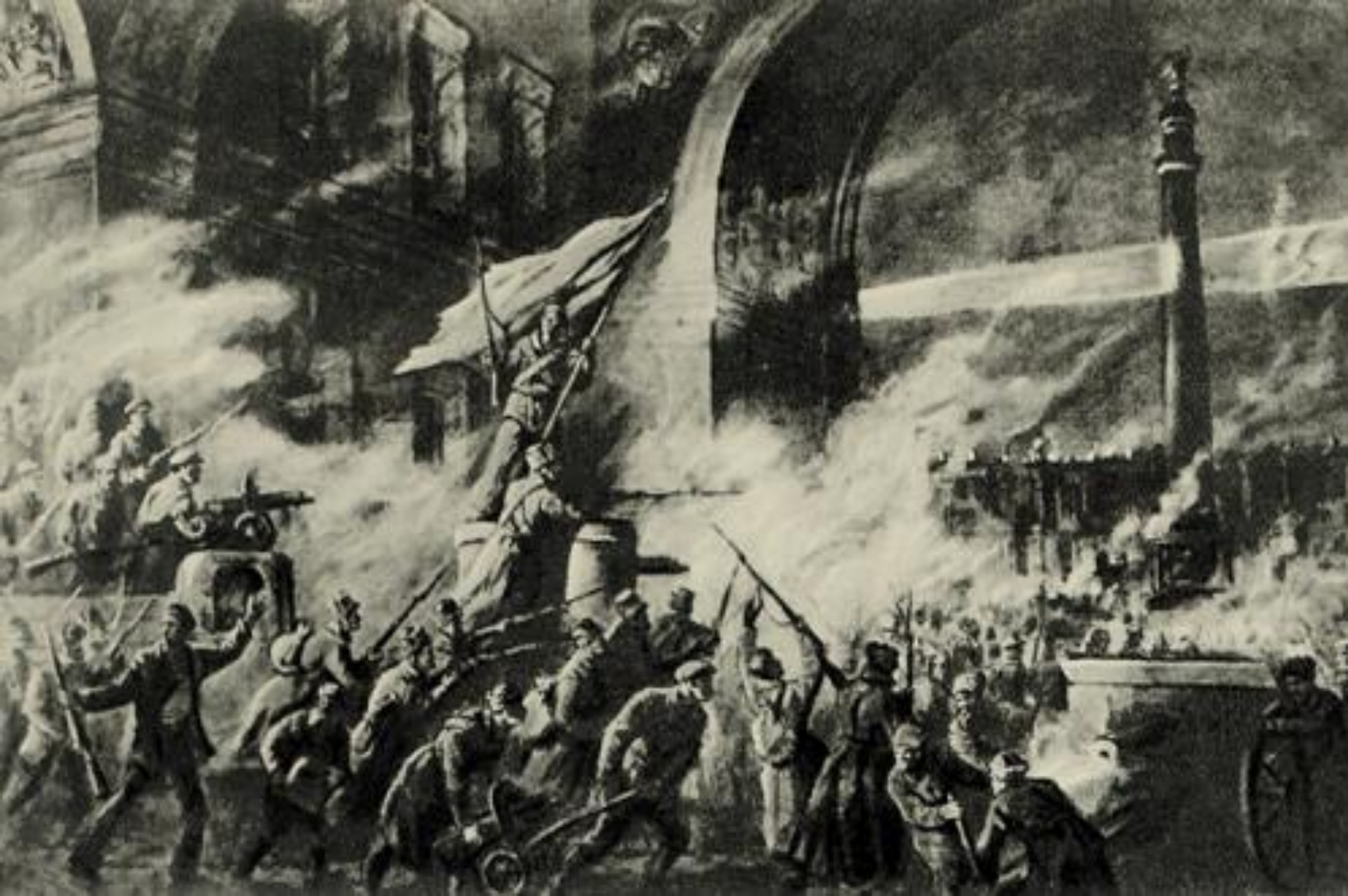
Октябрьская революция глазами современников