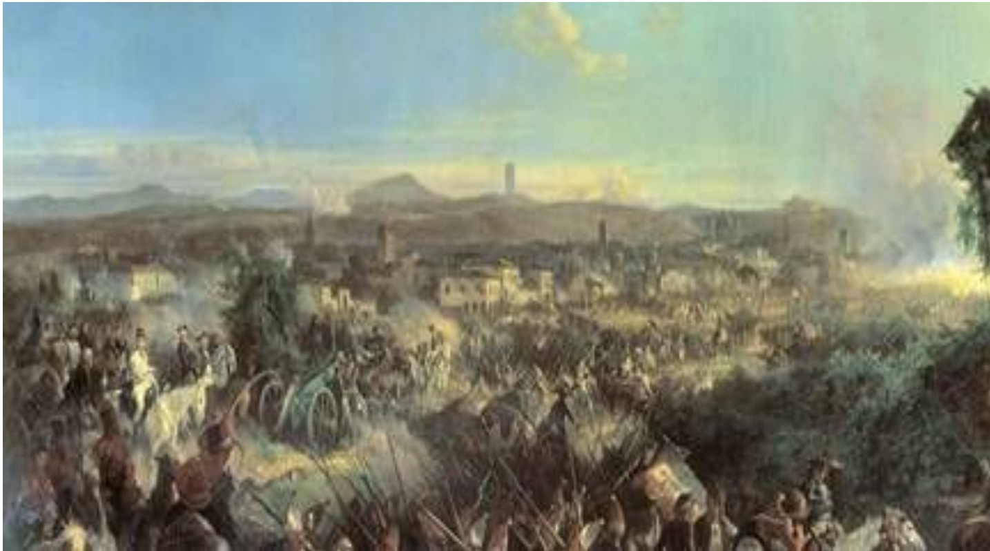
Битва при Нови, 1799 г.

В наследство от Директории Наполеону досталась не только разорённая Франция, но и войны с антифранцузскими коалициями. Первая из них была создана ещё в 1792 году. Её целью, как, впрочем, и последующих коалиций, было восстановление порядка во Франции. Под этим понималось возвращение монархии, уничтожение достижений революции. Заняв пост первого консула, Бонапарт решил отыгаться за неудачи 1799 года.