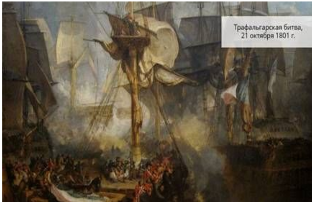
Трафальгарская битва, 21 октября 1801 г.

Английская эскадра, которой командовал знаменитый адмирал Горацио Нельсон , уничтожила флот противника. Сам Нельсон погиб, но эта победа закрепила за Великобританией господство на море. Англия подтвердила свой статус владычицы морей.