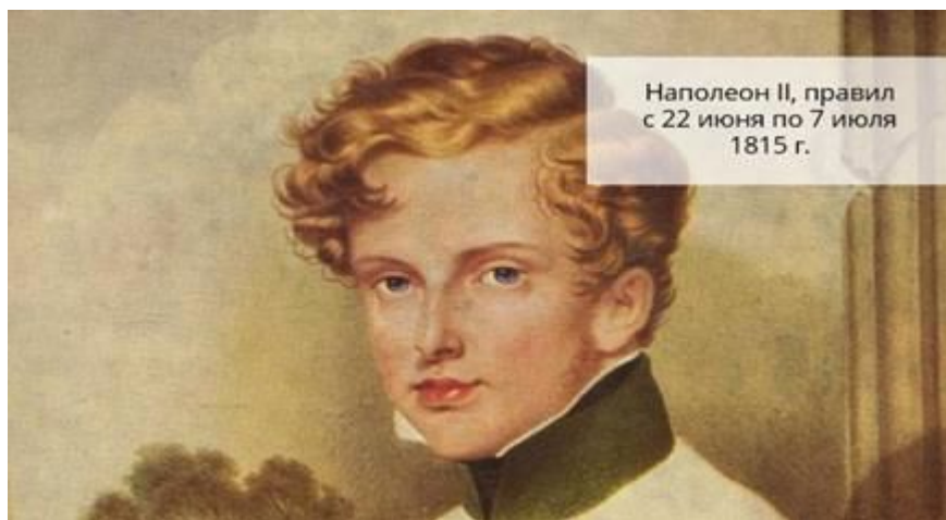
Наполеон II, правил с 22 июня по 7 июля 1815 г.

В браке Наполеона и Марии-Луизы родился сын, Наполеон Второй . Правда, царствовать ему пришлось всего две недели.