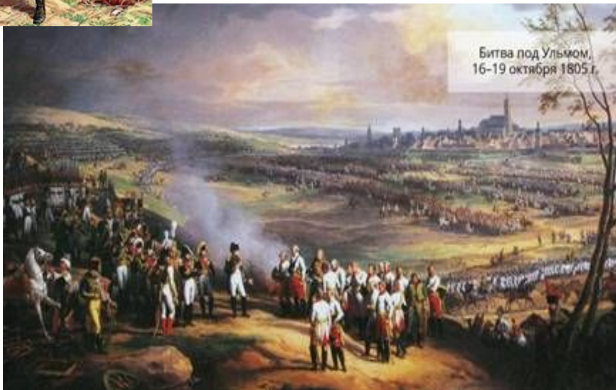
Битва под Ульмом, 16-19 октября 1805 г.

Меньше чем за 20 дней армия Наполеона достигла Дуная. И в сражении под Ульмом, в октябре 1805 года, разгромила австрийцев.