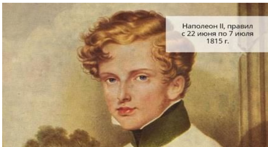
Наполеон II, правил с 22 июня по 7 июля 1815 г.

В браке Наполеона и Марии-Луизы родился сын, Наполеон Второй . Правда, царствовать ему пришлось всего две недели.