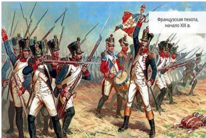
Французская пехота, начало XIX в.

Узнав о действиях союзников, император отказался от своих дерзких планов. Он двинул свои войска в Германию при этом сказав: «Если я через 15 дней не буду в Лондоне, то я должен быть в середине ноября в Вене».