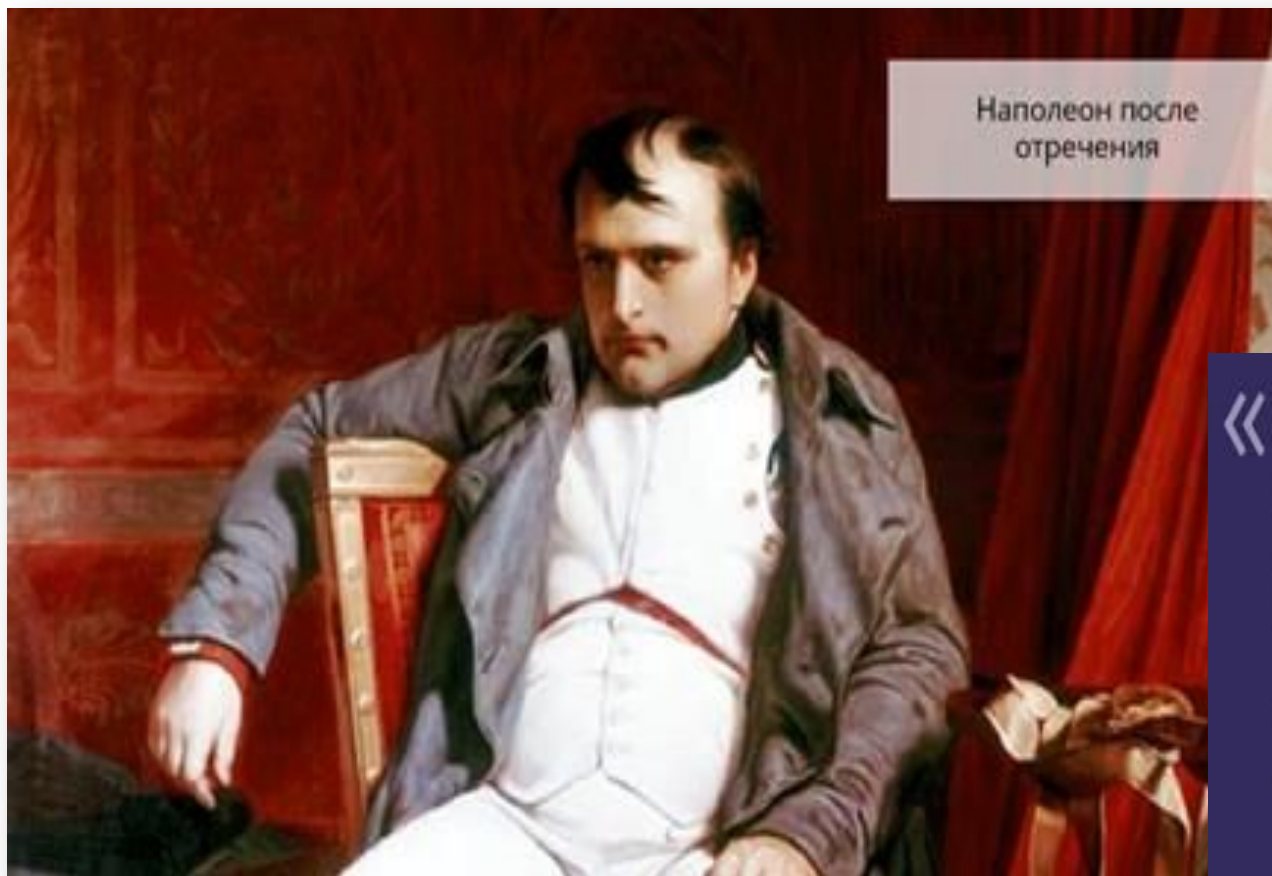
Наполеон после отречения

6 апреля 1814 года Наполеон отрёкся от престола. Союзники отправили его в почётную ссылку на остров Эльба у берегов Италии. При этом сохранив титул императора.