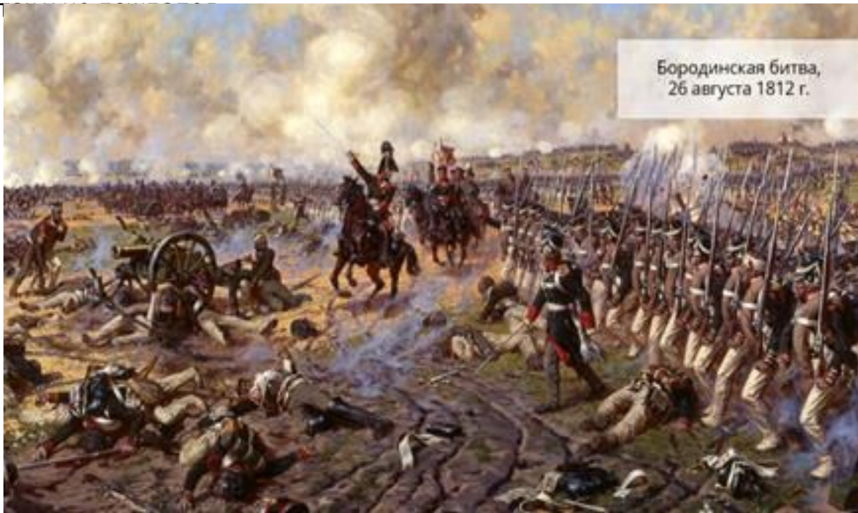
Бородинская битва, 26 августа 1812 г.

В решающем Бородинском сражении Наполеон не смог разгромить армию Михаила Илларионовича Кутузова . Тогда император занял покинутую жителями Москву. Но предложения мира от Александра I