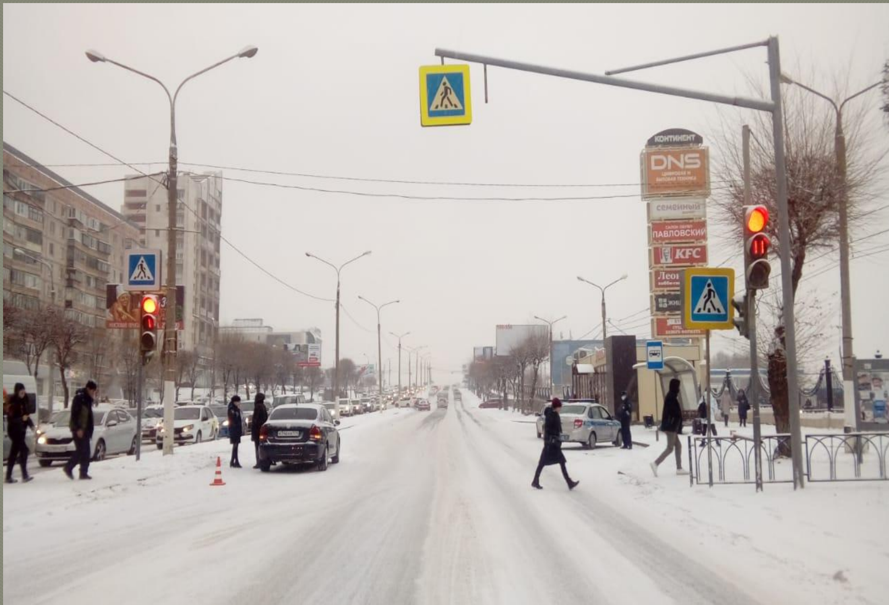
27 ноября 2020 г. в 14.20 в районе дома 83 по пр. Ленина наезд на двух пешеходов 9 и 10 лет, переходивших проезжую часть по регулируемому