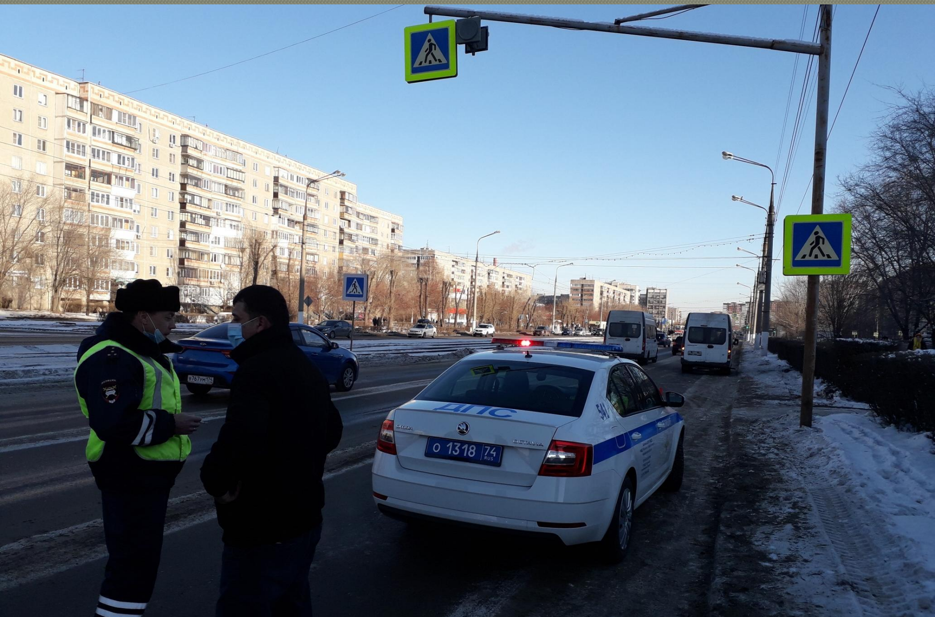
7 декабря 2020 года в 13 часов 15 минут 36-летний водитель, управляя автомобилем «Газель Некст», совершил наезд на пешехода, переходившего проезжую часть по нерегулируемому пешеходному переходу.