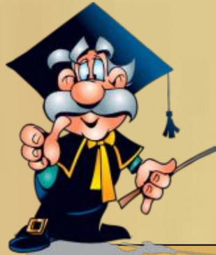
Схема предложения строится следующим образом: