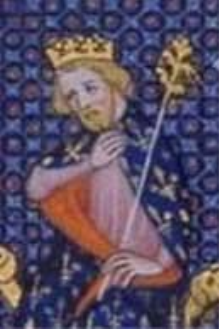
Карл Мартелл (715-741 гг.)