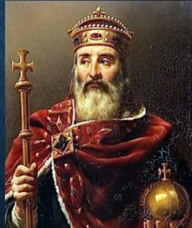
Карл Великий (768-814 гг.)

Первый король династии, захвативший престол в 751 г.