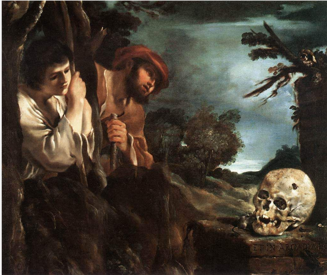
Гверчино Et in Arcadia ego 1618-22