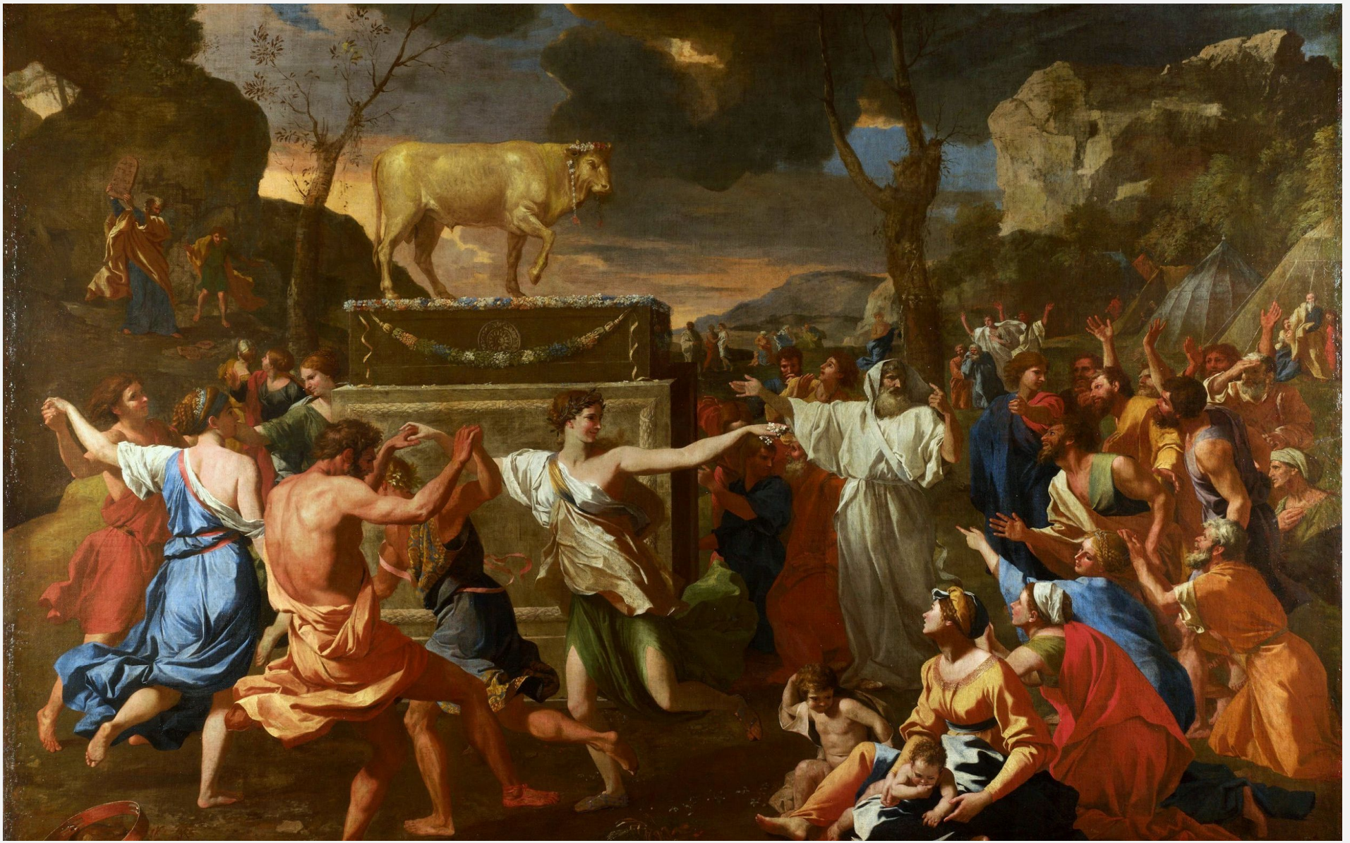
ПОКЛОНЕНИЕ ЗОЛОТОМУ ТЕЛЬЦУ