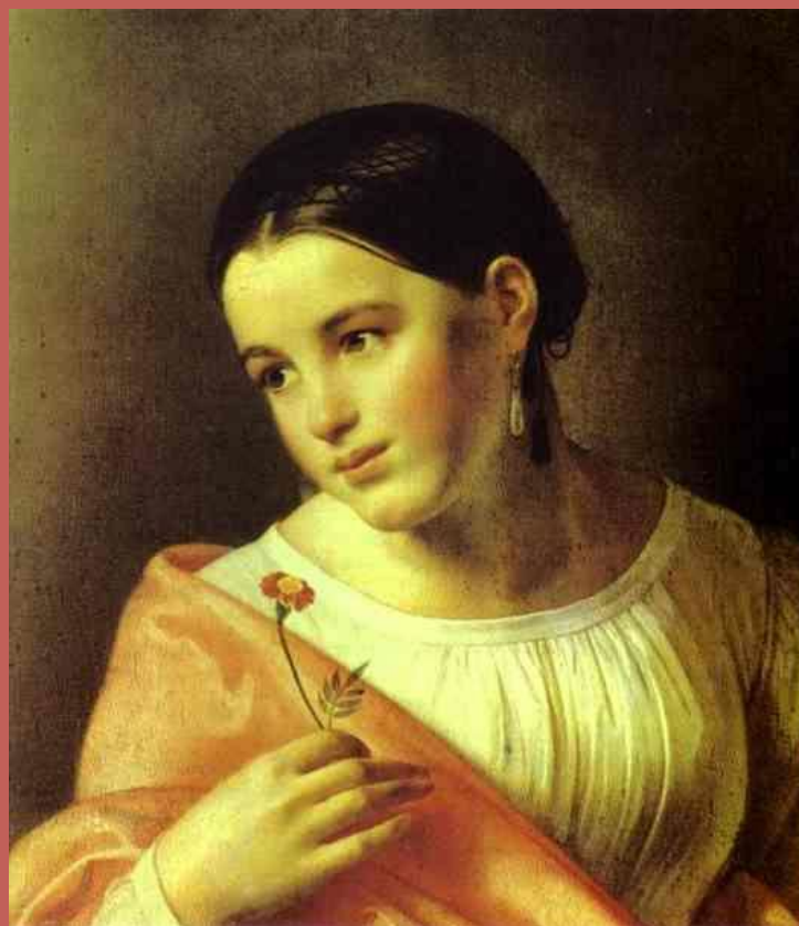
О. А. Кипренский. «Бедная Лиза»