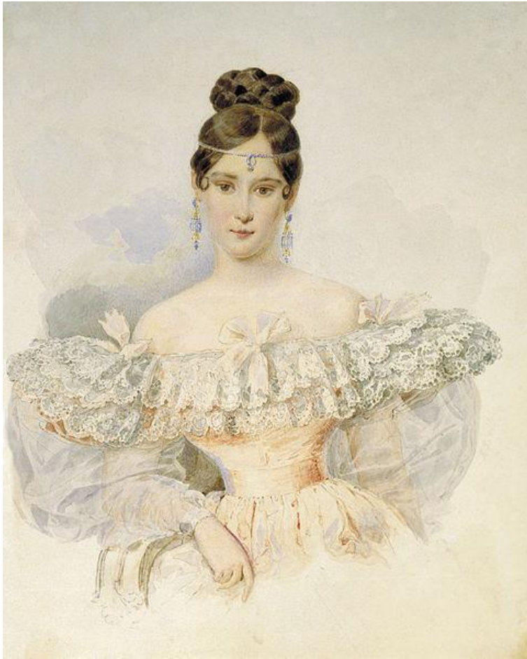
А. П. Брюллов. Портрет Н.Н. Пушкиной. Акварель, 1831—1832

«Гляделась ли ты в зеркало и уверилась ли ты, что с лицом твоим ничего сравнить нельзя на свете, а душу твою люблю я еще более твоего лица!»