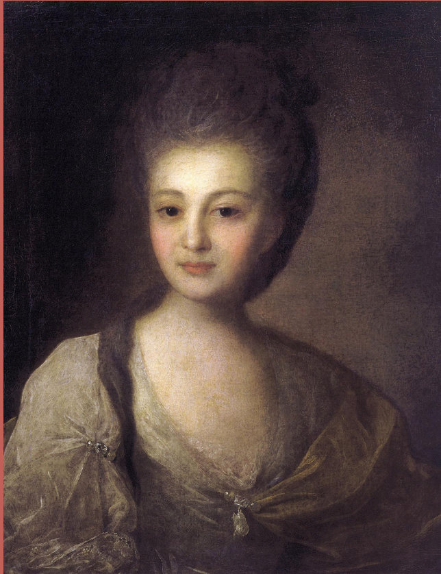
Ф.С. Рокотов. Портрет А. П. Струйской, 1772

Ты помнишь, как из тьмы былого, Едва закутана в атлас, С портрета Рокотова снова Смотрела Струйская на нас?