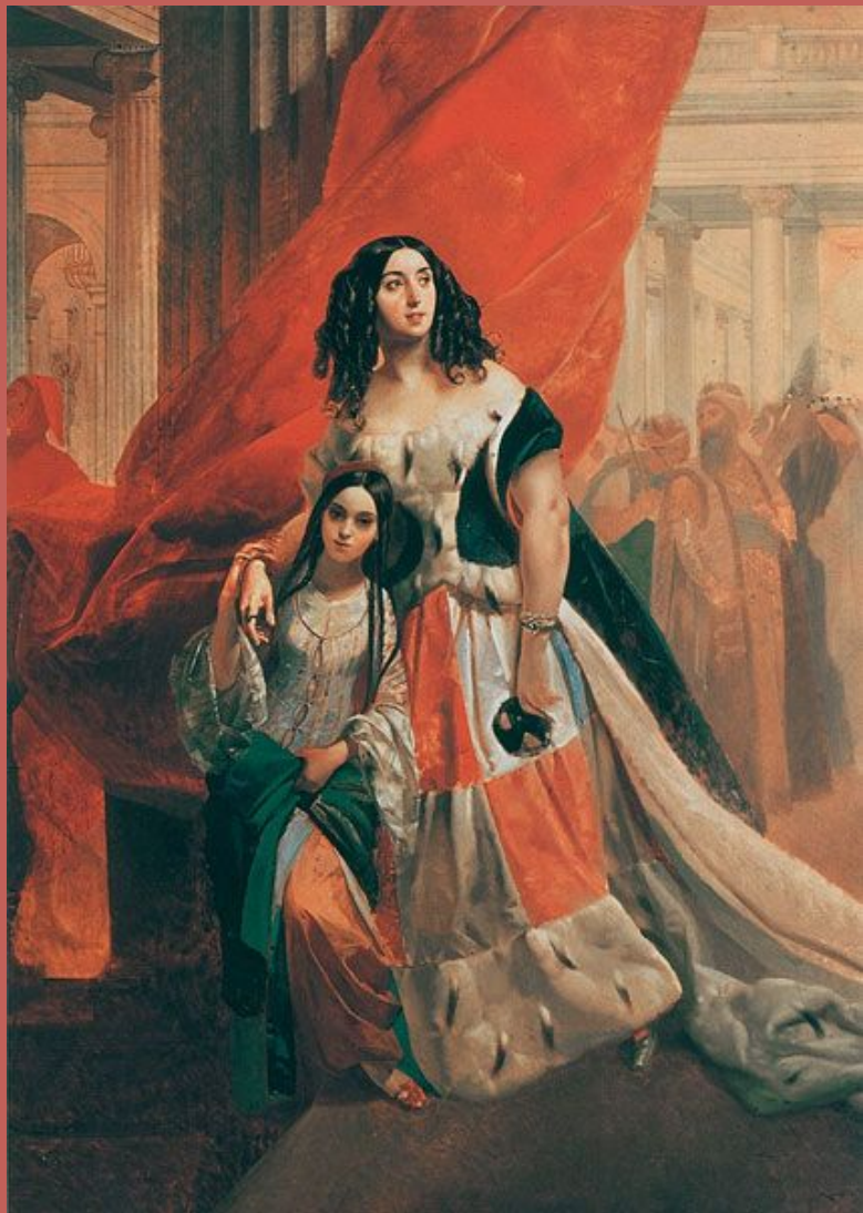
К.П. Брюллов. Портрет графини Ю.П.Самойловой, удаляющейся с бала у персидского посланника (с приёмной дочерью Амалией), 1842 год.