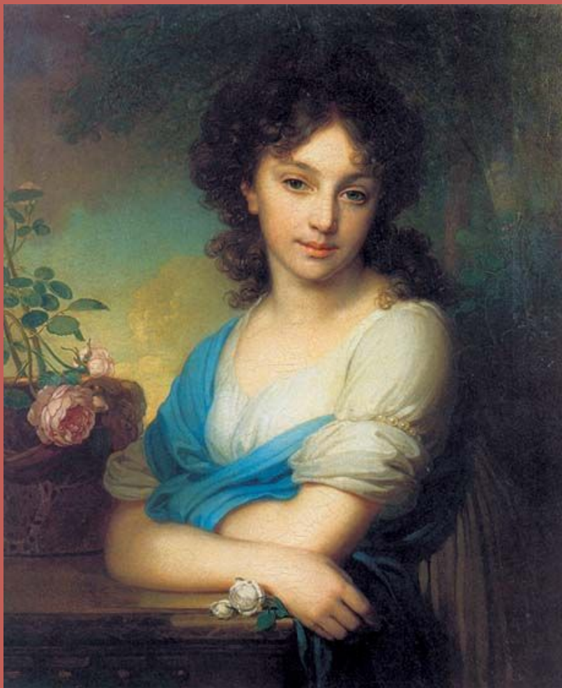
В.Л. Боровиковский. Портрет Е. А. Нарышкиной, 1799