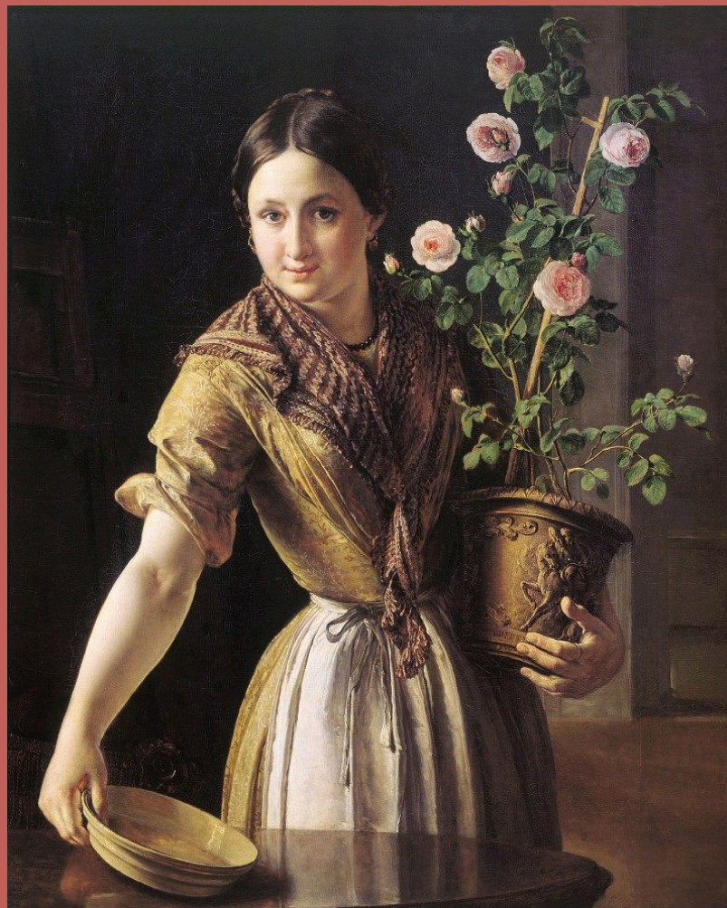
В.А. Тропинин «Девушка с горшком роз»