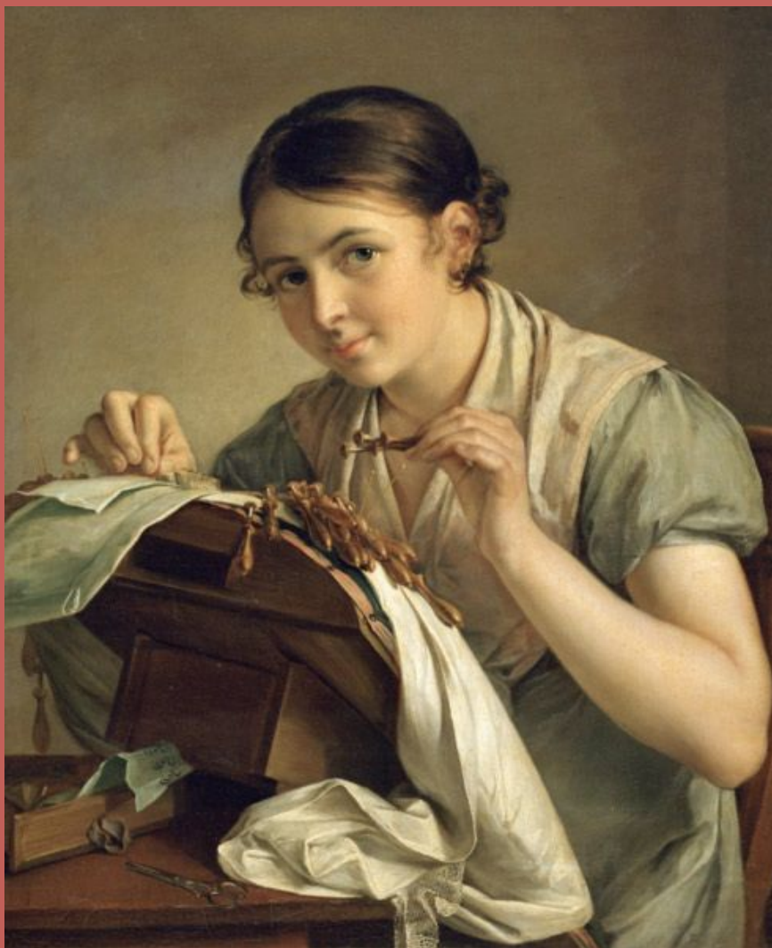
В.А. Тропинин. «Кружевница», 1823