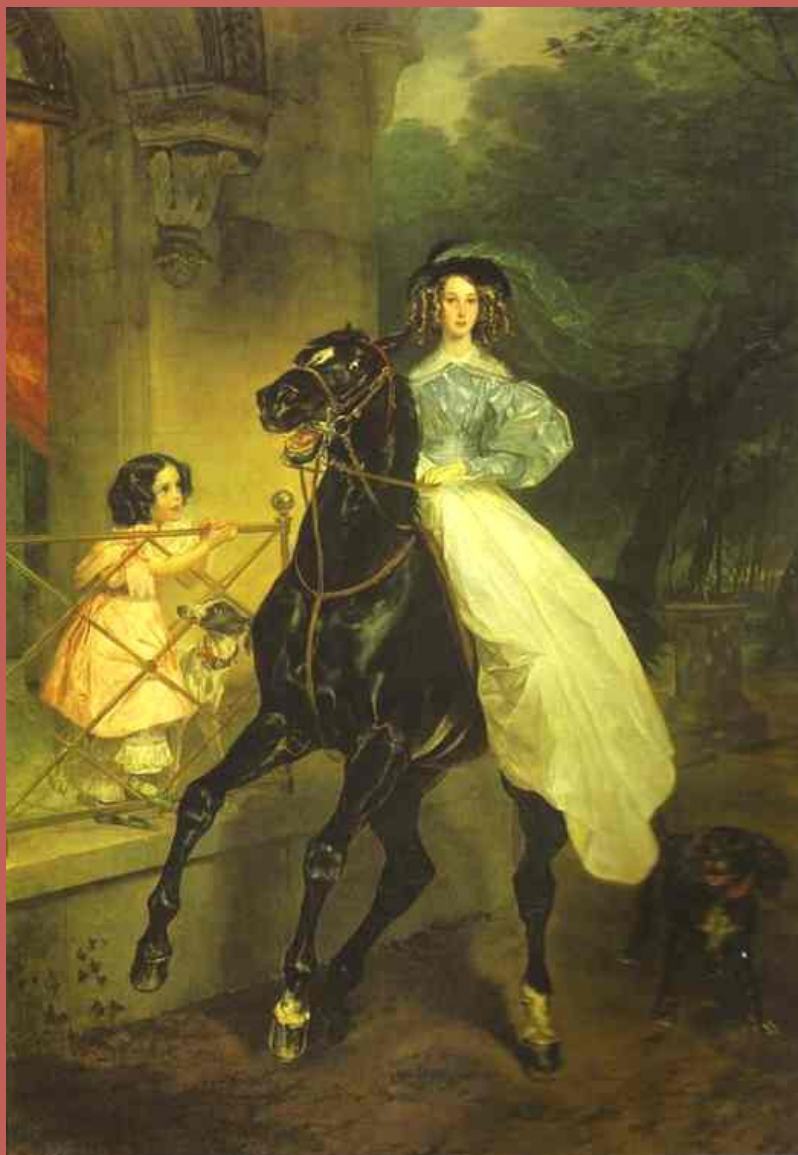
К. П. Брюллов. «Всадница»