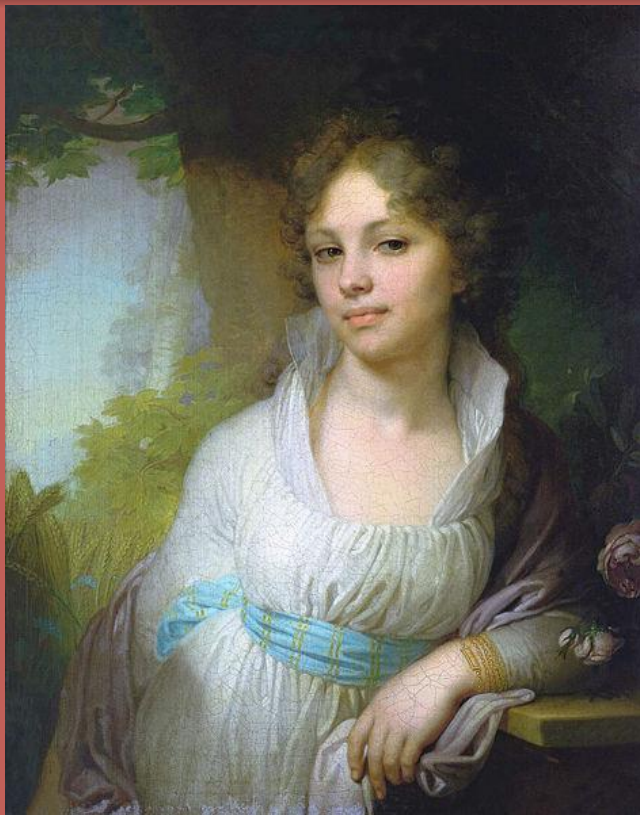
В.Л. Боровиковский. Портрет М. И. Лопухиной, 1797

Она давно прошла, и нет уже тех глаз И той улыбки нет, что молча выражали Страданье — тень любви, и мысли — тень печали, Но красоту её Боровиковский спас. Так часть души ее от нас не улетела, И будет этот взгляд и эта прелесть тела К ней равнодушное потомство привлекать, Уча его любить, страдать, прощать, молчать. Я. П. Полонский