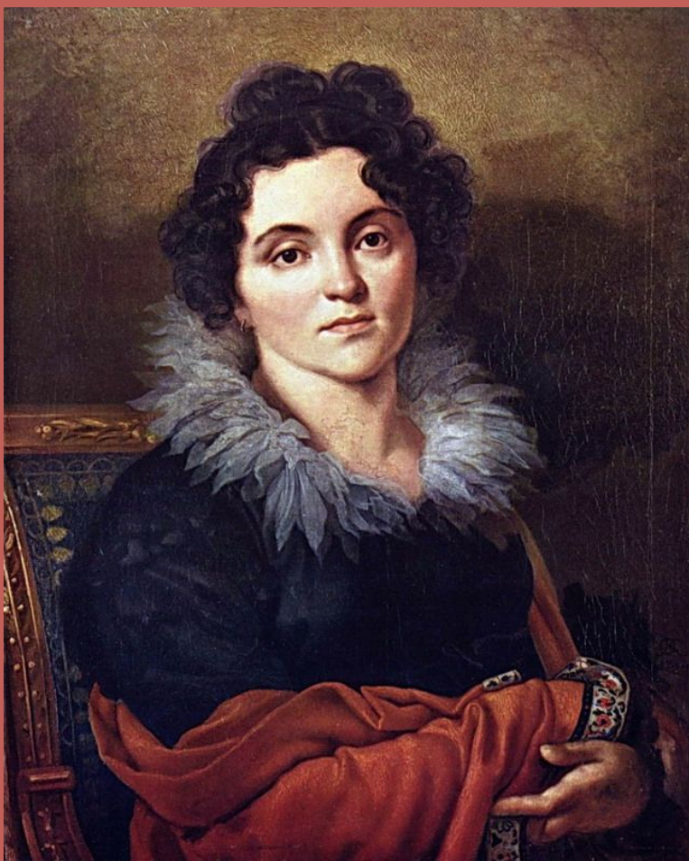
О.А. Кипренский. Портрет Д. Н. Хвостовой, 1827