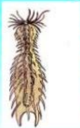
Құрсақ кірпікшелі құрт

Жұмыр құрттар- денесі буылтықтарға бөлінбеген, шұбаланқы, цилиндр пішінді немесе ұршыққа ұқсас жәндіктер