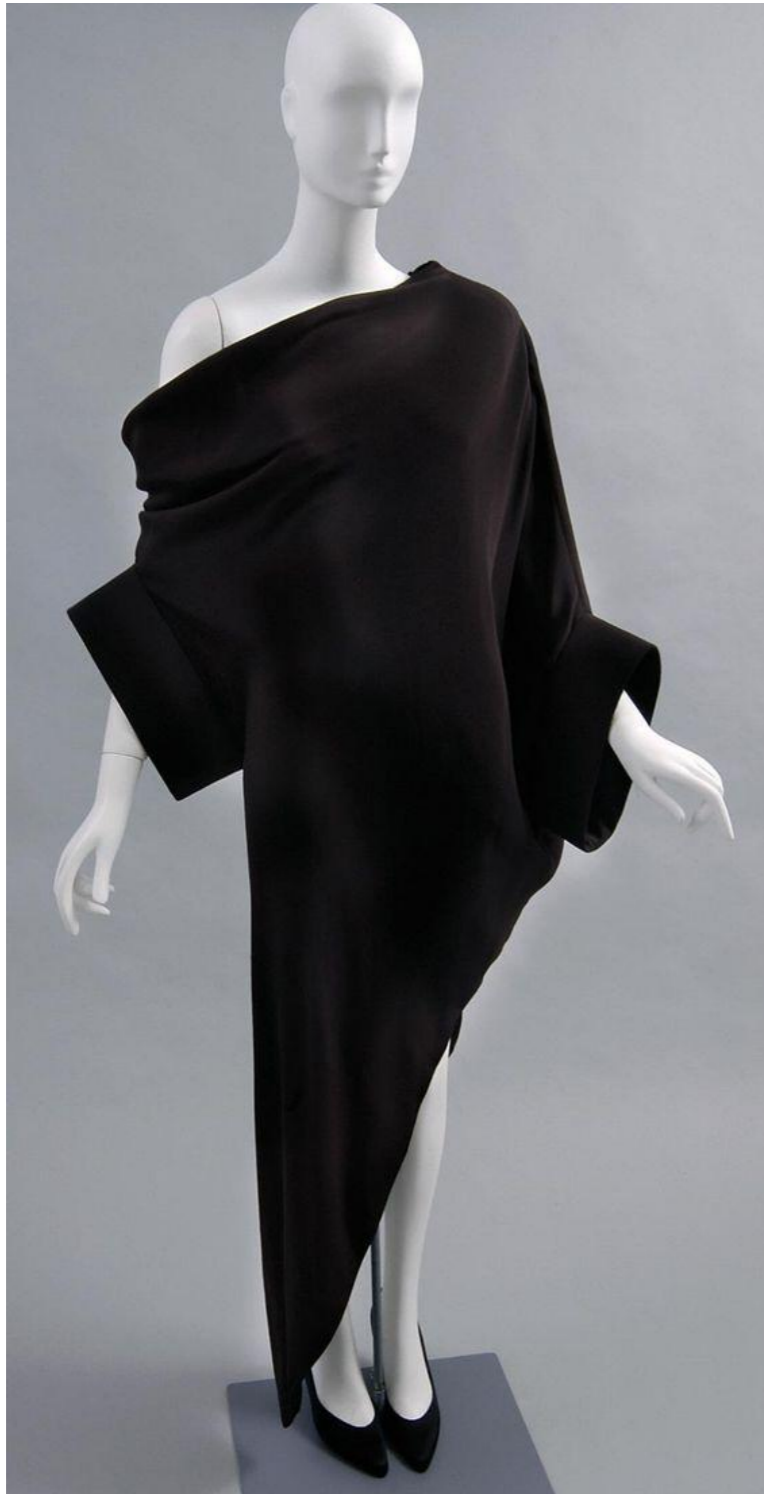
Pierre Cardin, 1989 г