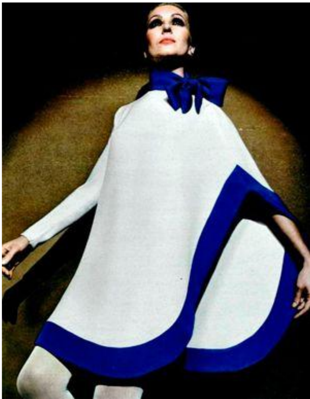
Pierre Cardin, 1969 г