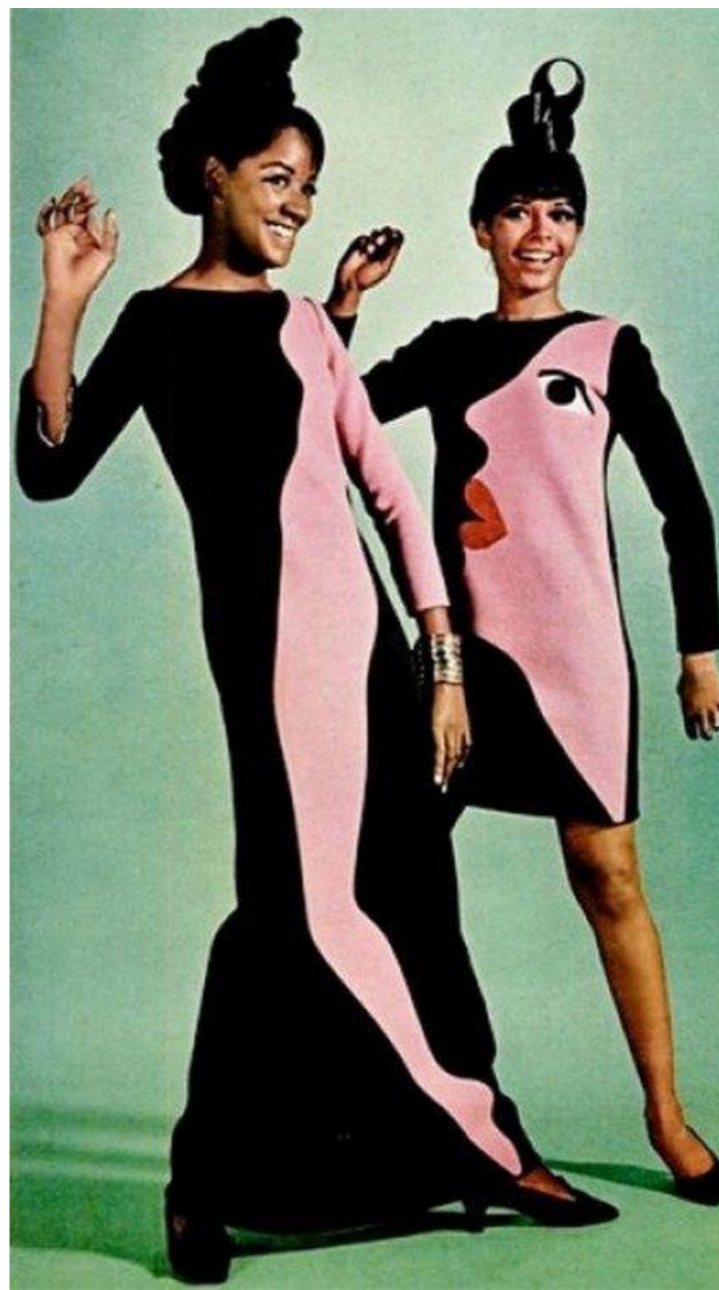
Yves Saint Laurent's