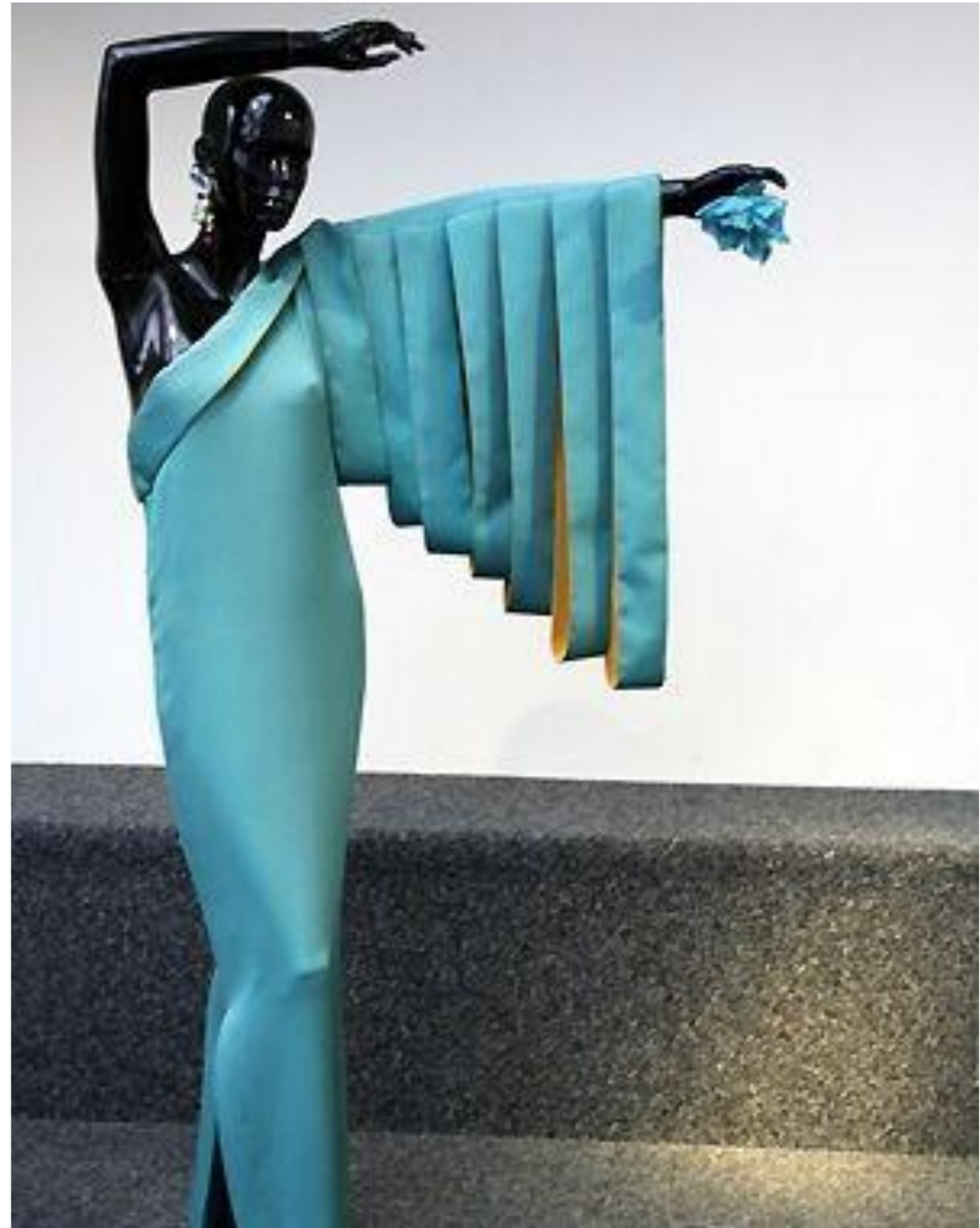
Pierre Cardin, 1992 г