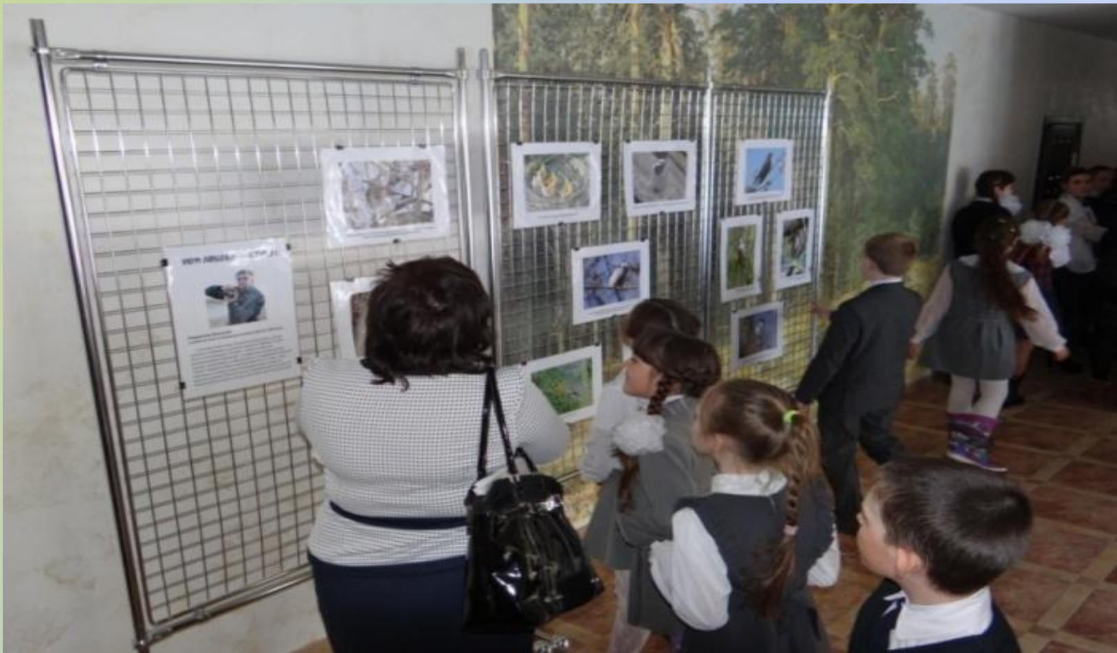
Авторская выставка фотографий «Моя любовь – птицы» на Центральной усадьбе Воронежского заповедника им. В.М. Пескова