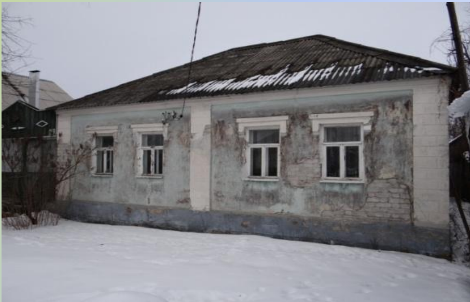
Дом на станции Тресвятской, где жила семья журналиста