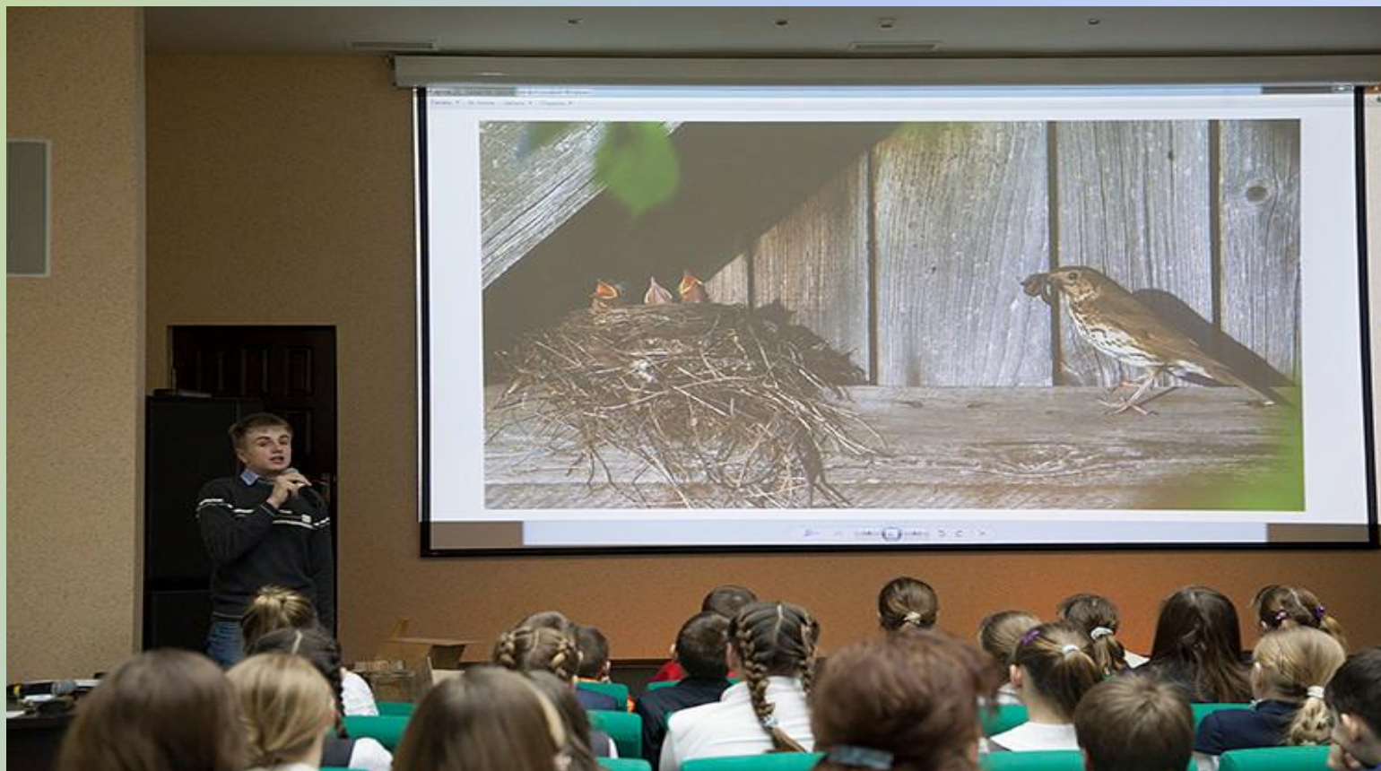
Выступление в Воронежском биосферном заповеднике на Дне птиц