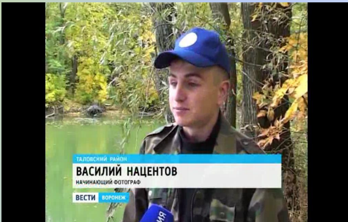
Фрагмент выпуска «Вестей-Воронеж» о природе Воронежского края