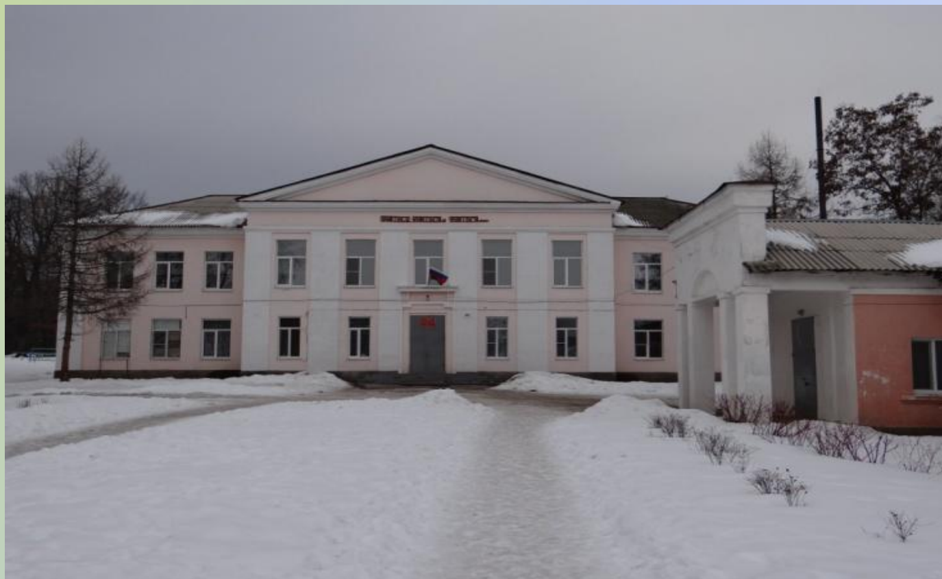
Здание МКОУ Тресвятской СОШ