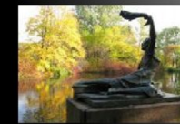
Герой Советского Союза (Посмертно).