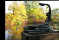
Герой Советского Союза (Посмертно).