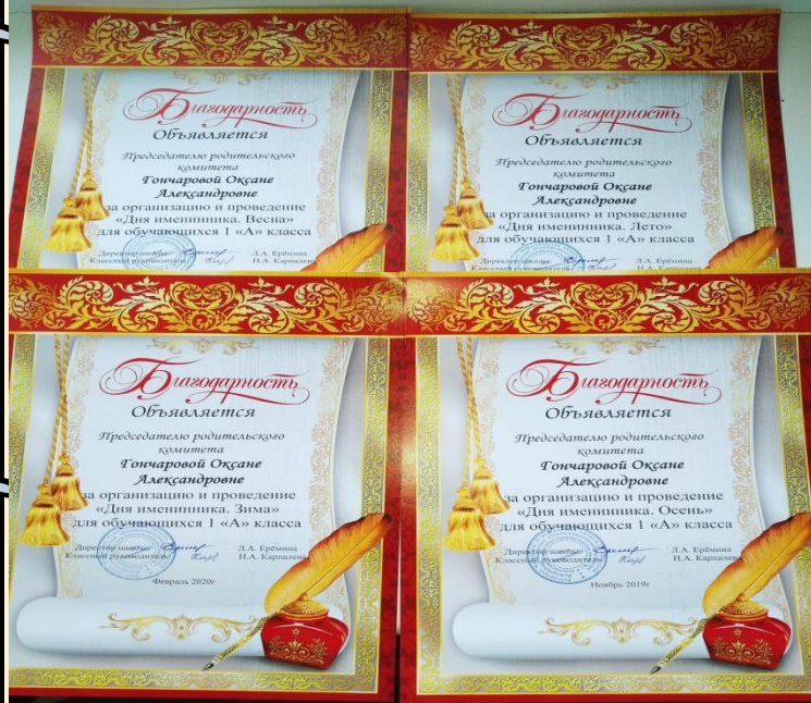
Дни именинника проводились по сезонам