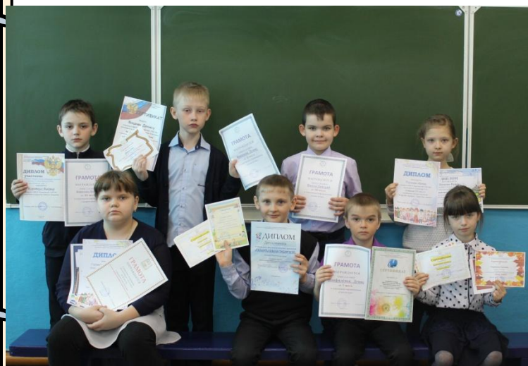
Награды наших детей