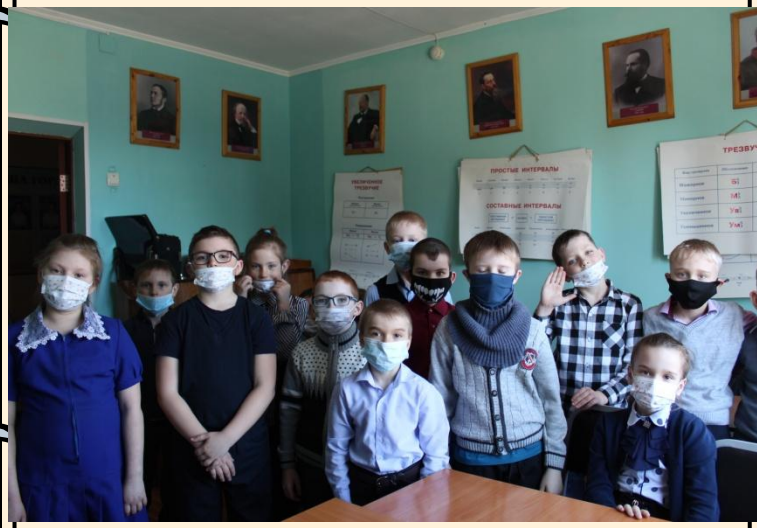
Экскурсия в районный музей