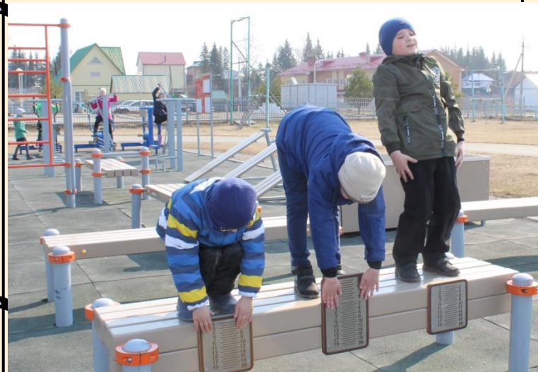
Спортивный час на стадионе ДЮЕШ