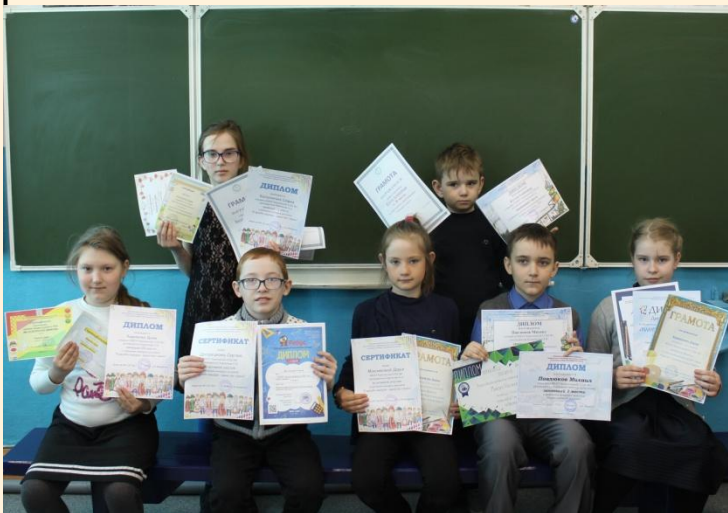
Еще награды детей и родителей