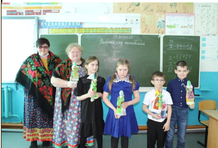
Мастер-класс по созданию традиционной народной куклы