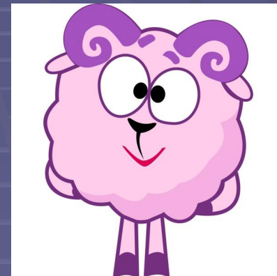
Fluffy - 10