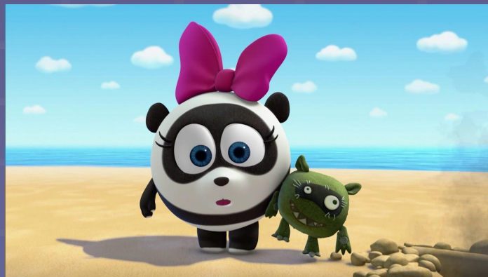
Pandy - 7