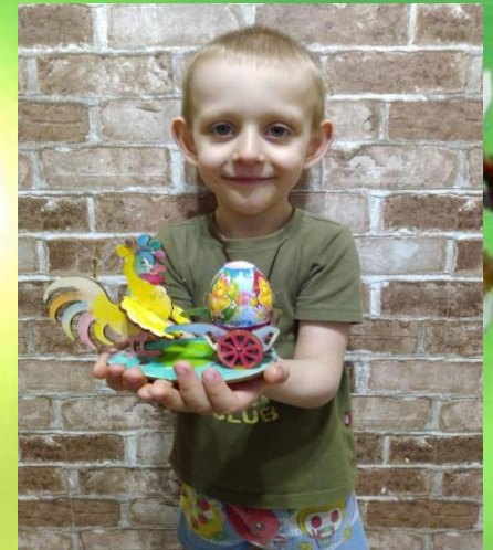
Наше весеннее дистанционное обучение с ребятами