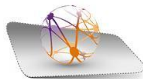
Инвестиционная компания "Архангельск"