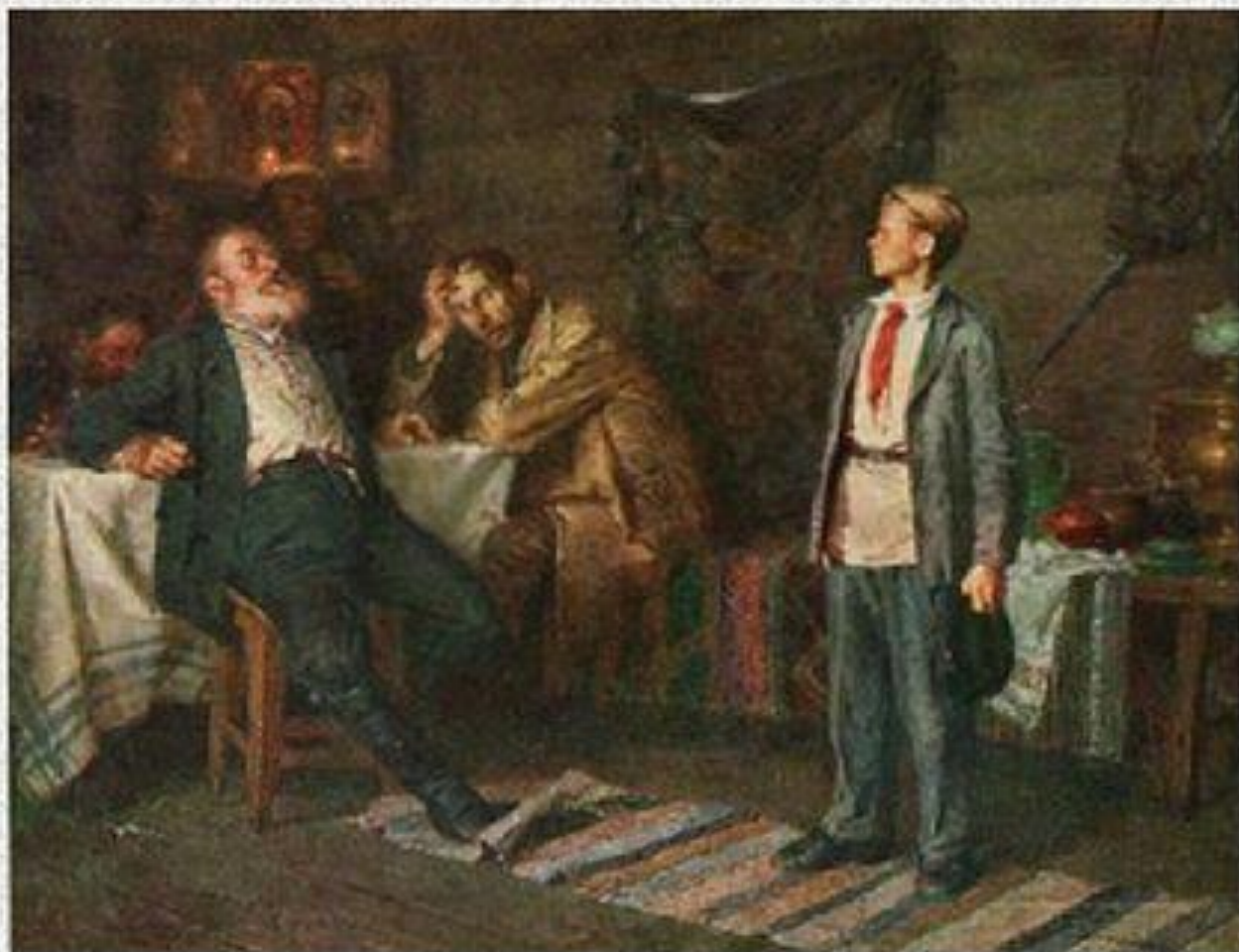
Н.Н. Чебаков Павлик Морозов

Павлик Морозов, согласно официальной версии отважно разоблачавший преступления кулаков против Советской власти и убитый ими из мести.