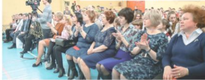
На церемонии подписания соглашения присутствовали директора всех школ и гимназий города