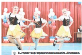
Выступает пореграфическая ансамбль «Веселухи»