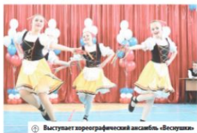
Выступает пореграфическая ансамбль «Веселушки»