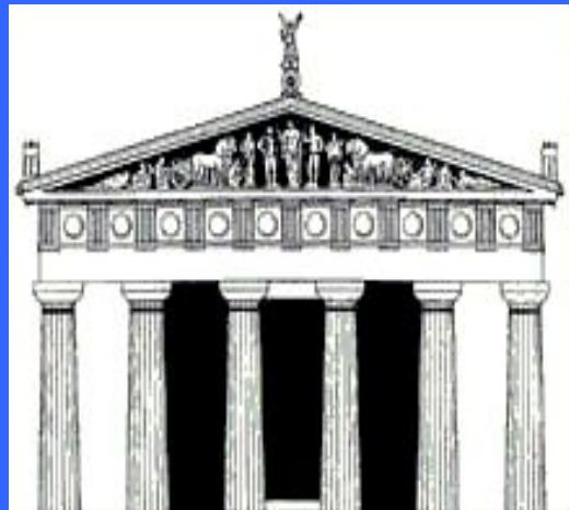
Храм Зевса в Олимпии

античности справлялись в честь Зевса Олимпийского через каждые четыре года, летом, в Элиде (области на северо-западе Пелопоннеса) в Священном городе Олимпии у подножия горы Олимп.