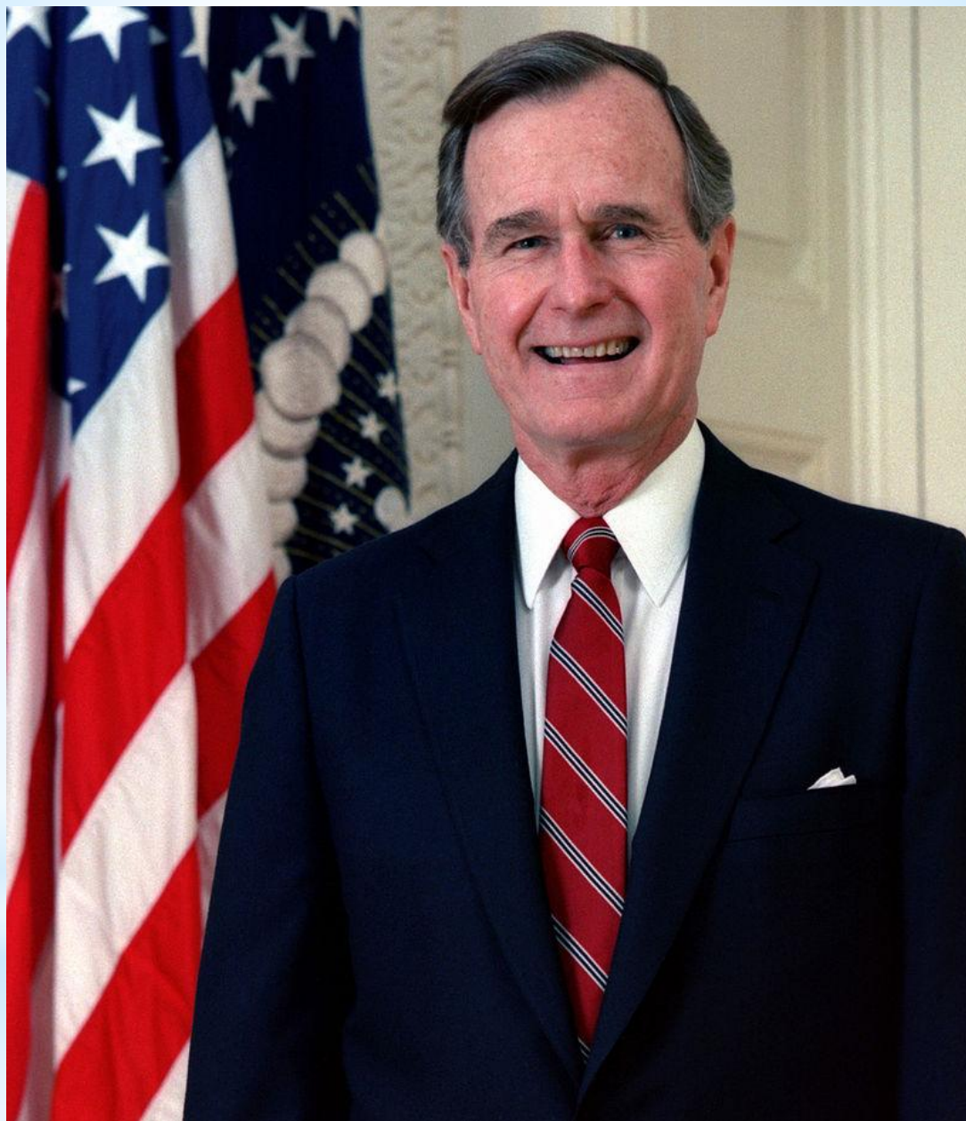
Джордж Герберт Уокер Буш