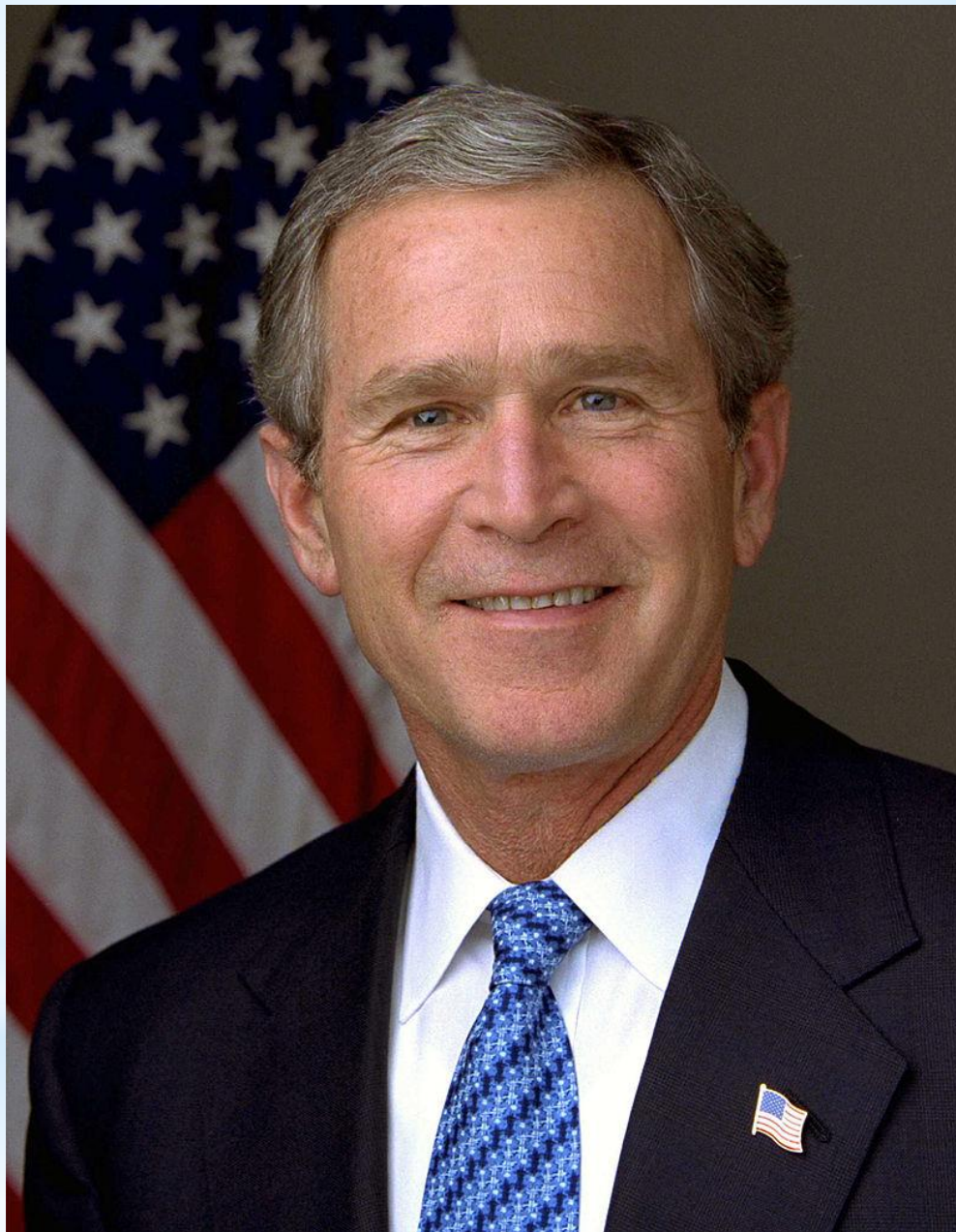
Джордж Уокер Буш