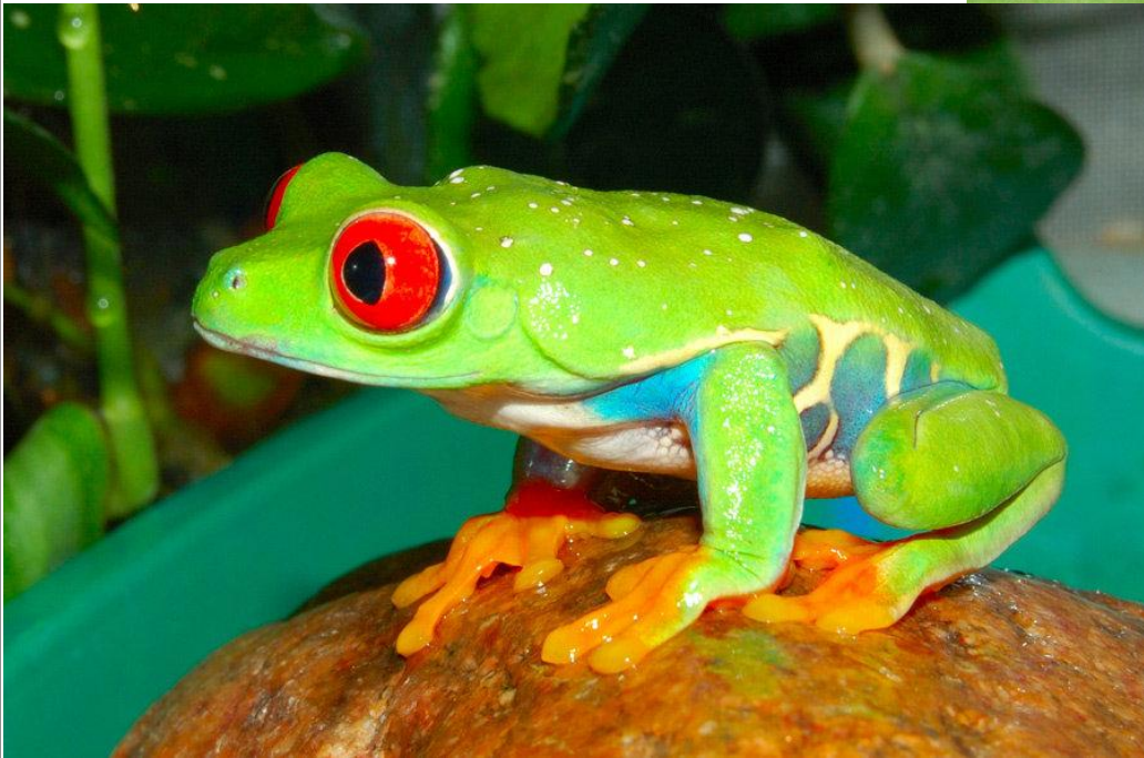
Красноглазые древесные лягушки