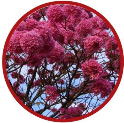
Кора муравьиного дерева