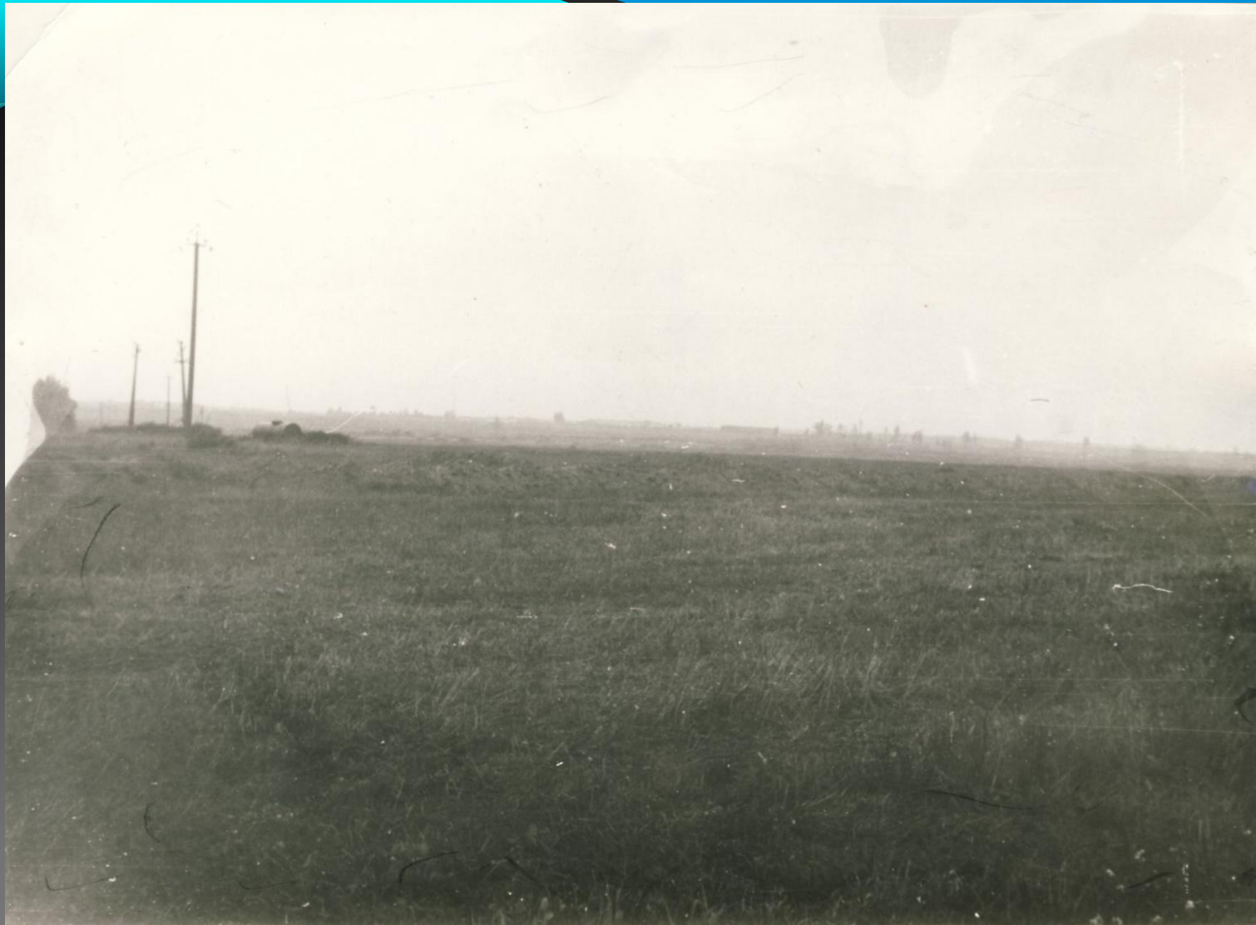
ПОЛЕ БОЯ, ГДЕ ПОГИБ И. КОСАРЕВ