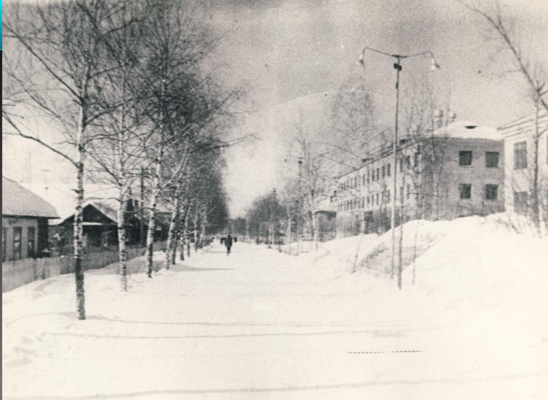
УЛИЦА И. КОСАРЕВА В ПОСЕЛКЕ ЯВАС